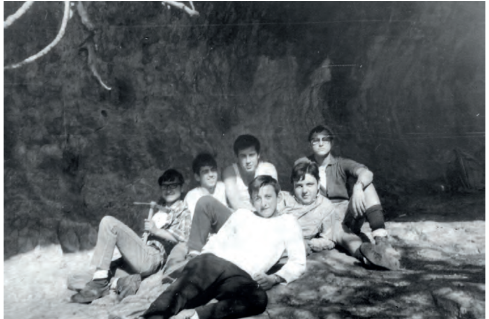
Grupo Arqueológico Petrelense