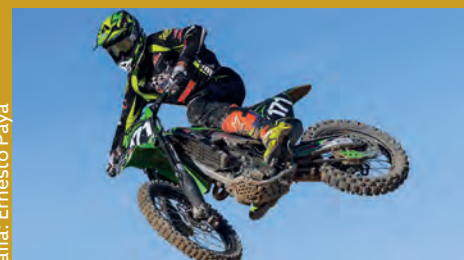
PETRER, FÁBRICA DE CAMPEONES DE MOTOCROSS