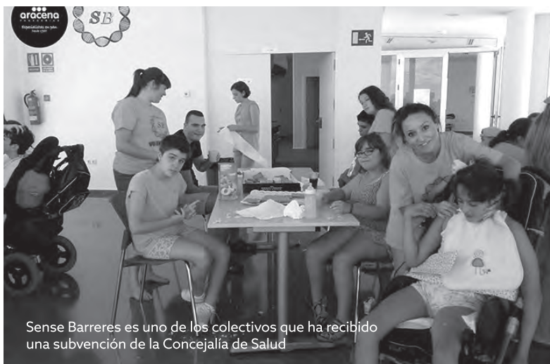
Sense Barreres es uno de los colectivos que ha recibido una subvención de la Concejalía de Salud

Fue, la pasada semana, cuando en Junta de Gobierno se acordó distribuir los 2.850 euros de esa línea de subvenciones entre tres asociaciones, que previamente se había aprobado en la Comisión Evaluadora.