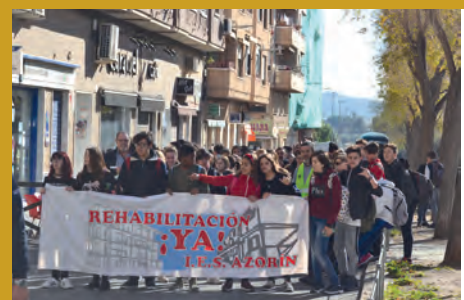
MARCHA REIVINDICATIVA POR LAS OBRAS EN EL IES AZORÍN