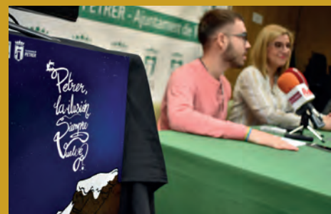
CAMPAÑA DE NAVIDAD: "PETRER, LA ILUSIÓN SIEMPRE VUELVE"