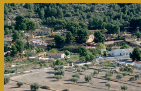
LOCALIZADO UN LABORATORIO DE COCAÍNA EN PETRER