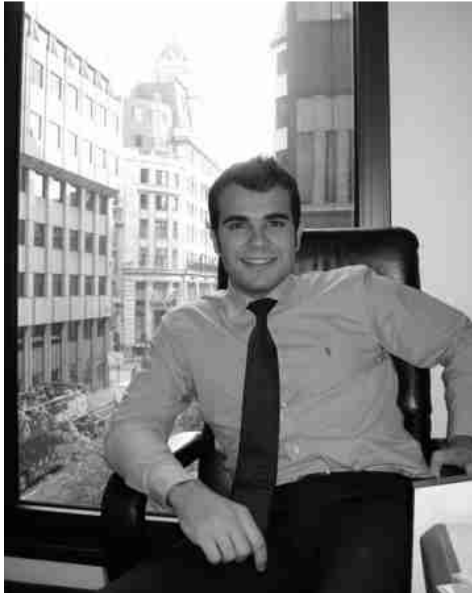
El autor de la idea en su despacho

Como siempre las instalaciones deportivas privadas han sido las primeras en "hacerse" con el programa informático. El Centro Excursionista Eldense, el Padelcoca de Novelda y varios clubes de la provincia ya cuentan con este portal. Los ayuntamientos, por cuestiones burocráticas y adminis-