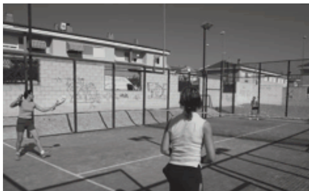
Practicantes de pádel en una de las pistas existentes en Petrer

trativas, son mucho más lentos a la hora de asimilar y materializar estos novedosos servicios. El de Petrer pronto lo incorporará. Solamente restan algunos