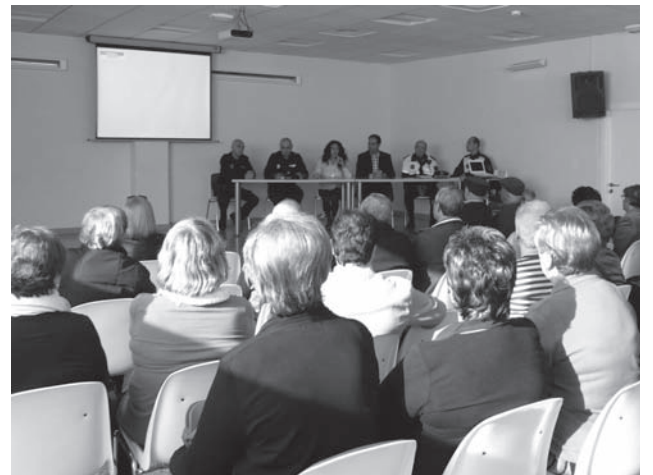
Las charlas se realizaron en el Salón de Actos de "Las Cerámicas"

No obstante, ha puntualizado que el voto del Bloc va a depender en gran parte del resultado de la Asamblea Abierta del próximo lunes. ●