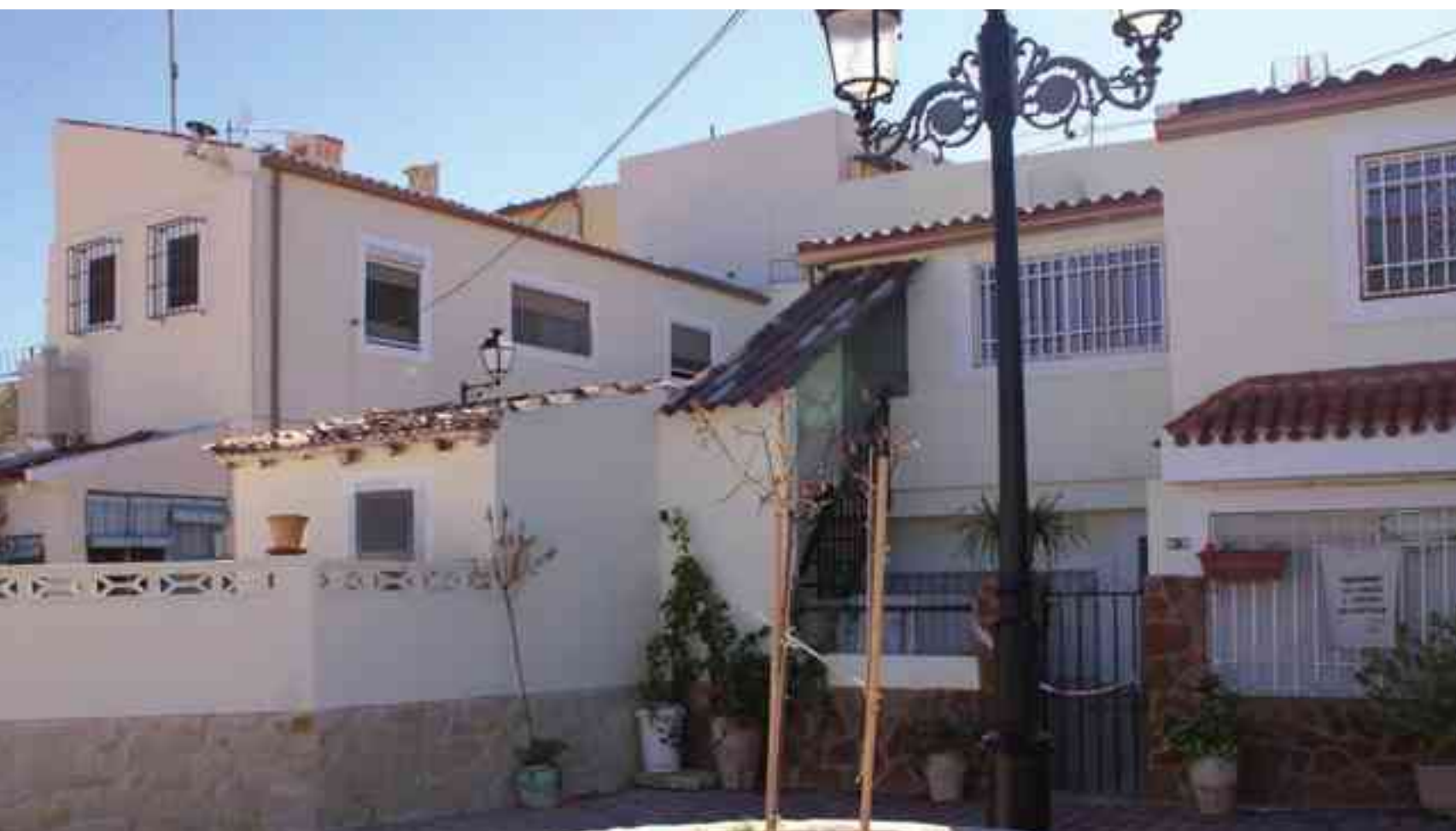
Una partida para finalizar la rehabilitación de algunas casas-cuevas de la zona de la calle de San Hermenegildo

del Polígono Industrial "Les Pedreres", 117.000 euros. El concejal de Hacienda ha explicado que se ha incluido ese primer pago de la indemnización en el Capítulo de Inversiones porque se interpreta como una compra de terrenos. Se trata, en definitiva, de inversiones de urgencia que no se podían dejar fuera del Presupuesto, ha apuntado Fermín García que, además, ha explicado que aunque las inversiones sean escasas, la inversión en el mantenimiento de zonas verdes, centros educativos, edificios municipales y públicos va a ser muy elevada para evitar que se deterioren. El Capítulo de Gasto de Personal asciende a