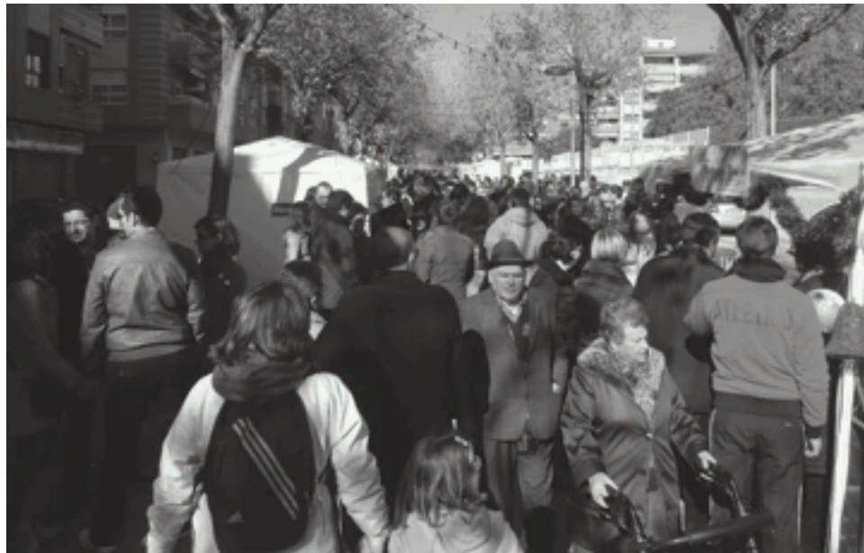
Tanto el sábado como el domingo, el público abarrotó la feria