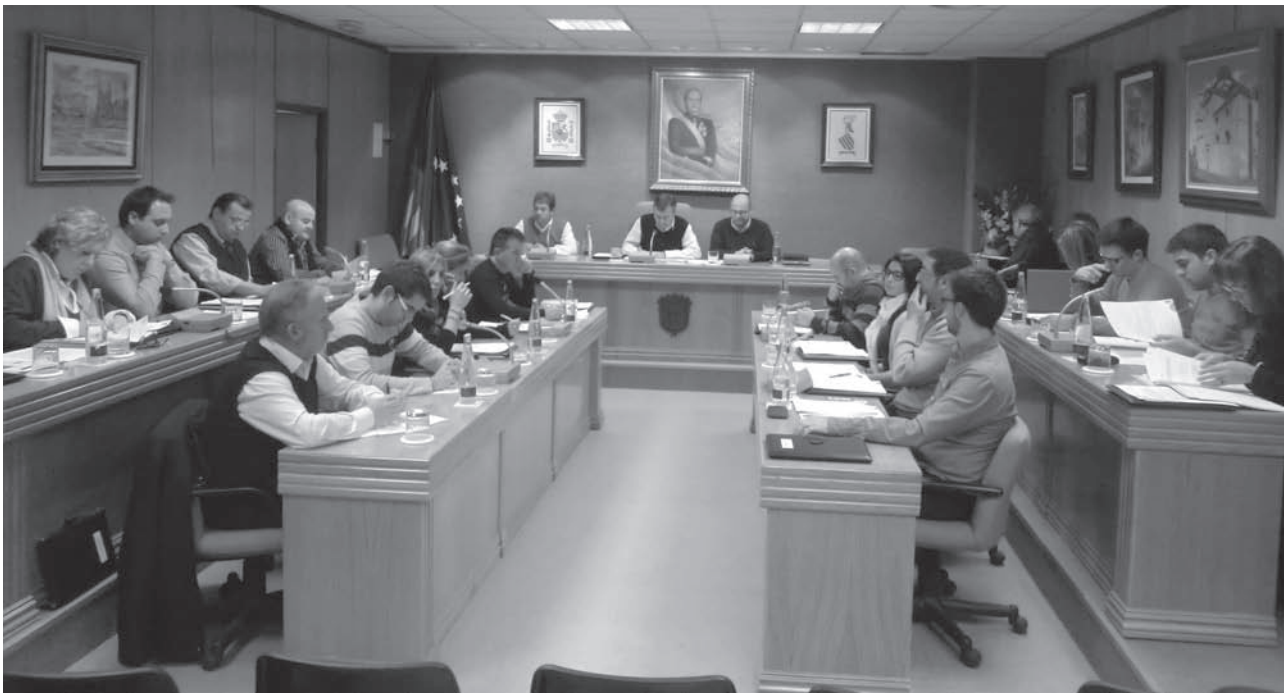
Imagen del pleno celebrado el pasado jueves