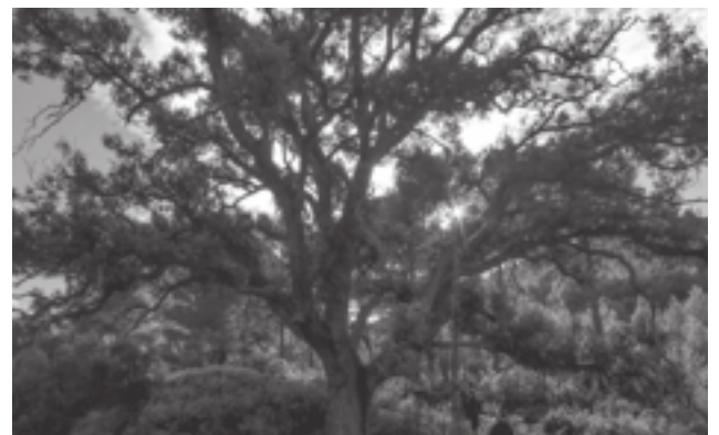
Árbol monumental en L'Administració de Catí

emocional y la formación en crecimiento y desarrollo personal entre el alumnado de educación secundaria y bachillerato por medio de actividades pedagógicas que favorezcan en estos jóvenes una formación más completa y profunda. ●