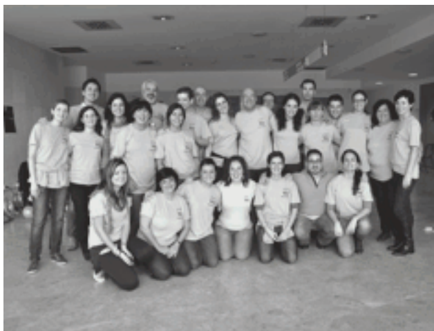
Voluntarios de "Desata tu potencial"

Hace unos días, la Asociación Desata tu Potencial, dedicada a la formación en crecimiento y desarrollo personal impartió en Petrer un curso en Marketing Personal (con PNL) con el objetivo de ofrecer a los participantes herramientas eficaces que les ayudasen a mejorar su relación con otras personas, cultivar su autoconfianza o valorar su imagen personal y autoestima.