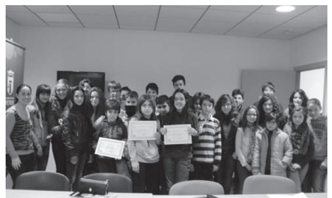
Imagen de uno de los grupos participantes

El 3er. grupo finalizó el sábado 1 de diciembre de 2012, compuesto por 27 chicas y chicos de la ESO. Éste se llevó a cabo en la sala polivalente de la Concejalía de Educación e impartido por la psicóloga, Magdi Iborra. ●