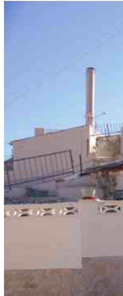
En los Presupuestos Municipales se contempla un

Respecto al Capítulo de Inversiones, cabe destacar que asciende a tan sólo 507.000 euros ya que sólo contempla actuaciones de urgencia: rehabilitación del muro de mampostería del mirador de la Plazola de la ermita de San Bonifacio, 350.210 euros, construcción de nichos en el Cementerio Municipal, 40.000 euros, IV fase del proyecto de rehabilitación de las casas-cuevas, 59.000 euros y primer pago de la indemnización por la expropiación de unos terrenos para la urbanización