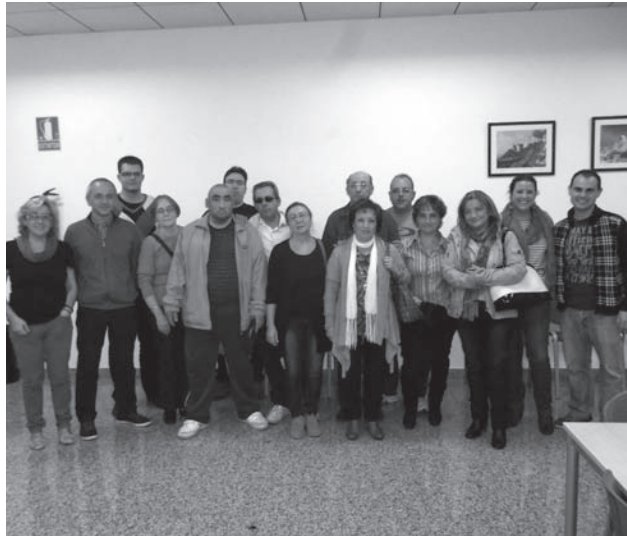
Imagen de archivo de la asamblea 18% del pasado año