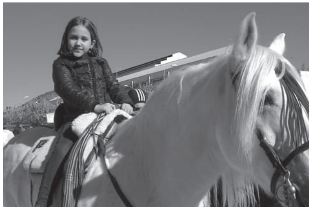
Los caballos hicieron las delicias de los más pequeños

supuesto el enclave de la feria y de la apuesta de la asociación y de la concejalía de Comercio con este evento con el fin de dinamizar la actividad comercial en nuestra población. Una iniciativa que a tenor del éxito, había contribuido también a subir el ánimo, tanto de comerciantes como de público. Según el vicepresidente, todos han hecho una