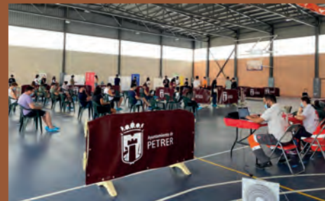
EL 84% DE LOS MAYORES DE 12 AÑOS YA ESTÁN VACUNADOS