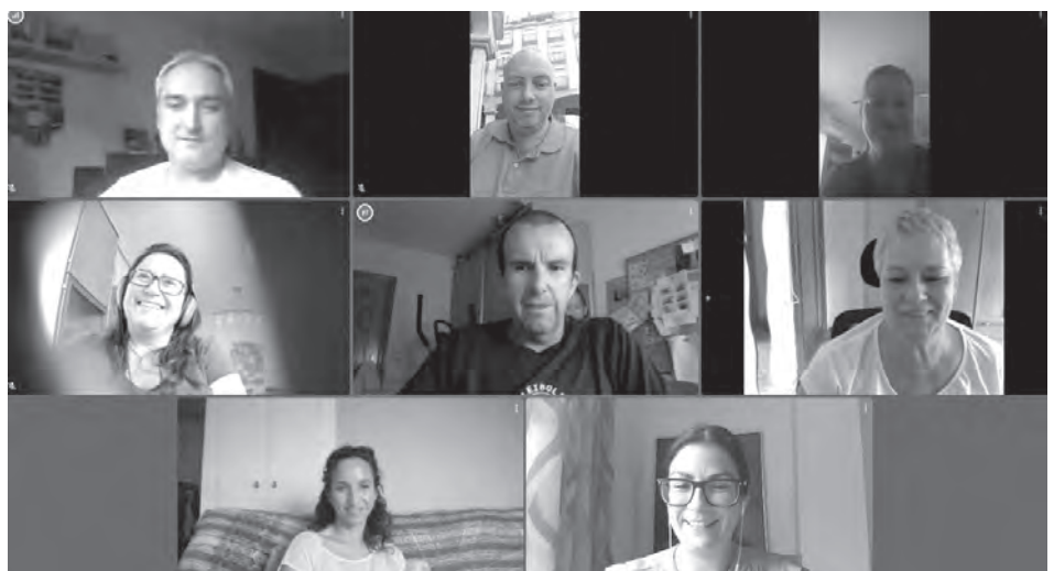
Foto del Grupo de Taller de Participación Ciudadana

La concejalía de Participación Ciudadana del Ayuntamiento de Petrer ha recibido una subvención de la Diputación de Alicante para la realización de la actividad "Escuela de participación online", que la concejalía llevó a cabo los pasados meses de mayo y junio con varios talleres virtuales gratuitos para asociaciones y entidades con el objetivo de mejorar su gestión y la propia actividad de las mismas, ayudándoles a afrontar el reto digital. El propósito de la concejalía es, en los próximos meses de octubre y noviembre, teniendo en cuenta la buena acogida de los primeros talleres, volver a abrir la oferta con nuevos cursos formati-