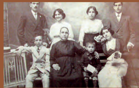
SOM DE PETRER: FAMILIAS DE PETRER DE HACE UN SIGLO

DEL 17 AL 23 DE SEPTIEMBRE DE 2021 ■ ANY XLII ■ Nº 1369 ■ 1€