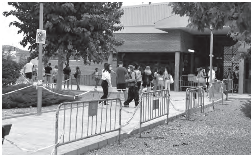
Vecinos de Petrer en los exteriores del polideportivo San Jerónimo

en disposición de vacunarse ya que hay que tener en cuenta que debe excluirse al grupo de personas de 0 a 12 años que no entran dentro del proceso.