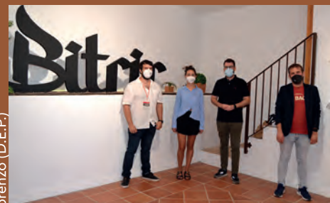
LAS JORNADAS DE PATRIMONIO LOCAL, ESTE FIN DE SEMANA