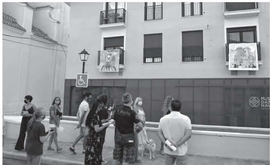
Imagen de alguno de los lienzos colgados en diversos lugares de la población

Previamente a la inauguración, se llevó a cabo un taller en el que un grupo de niños de forma conjunta pintaron un gran lienzo que, más tarde, colgaron en el balcón del edificio del Ayuntamiento de nuestra localidad.