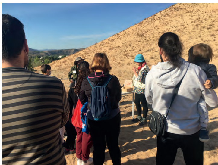
Visita teatralizada al Arenal de l'Almorxó

Para garantizar la salud y seguridad de las personas participantes, el uso de la mascarilla será obligatorio durante la actividad.