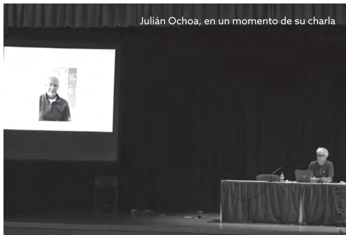
Julián Ochoa, en un momento de su charla

A iniciativa del Grup Fotogràfic Petrer, el pasado viernes, en el Centro Cultural, el prestigioso fotógrafo gaditano, Julián Ochoa, ofreció una charla sobre el "Apropiacionismo" en la que analizó y aclaró detalles sobre esta práctica, cada vez más habitual y jurídicamente protegida, de apropiarse de las ideas y fotografías de otros.