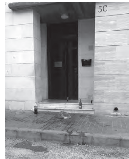
Estado de un portal de La Canal