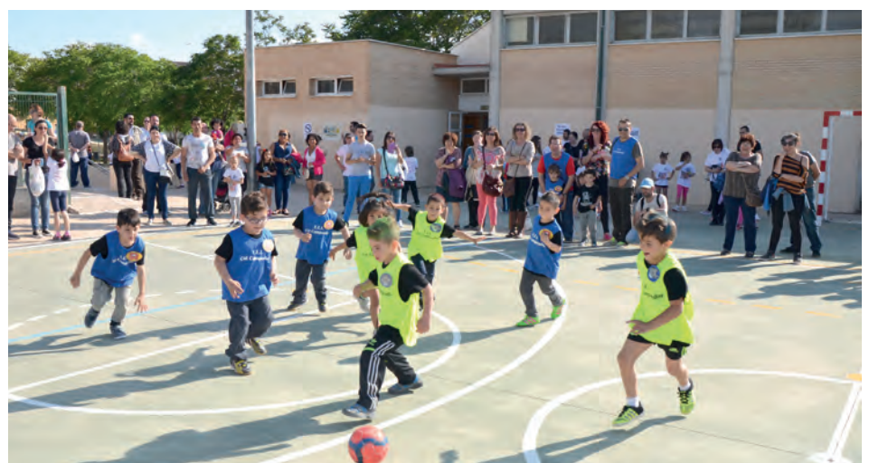
Imagen de archivo de las XII Horas Deportivas en un centro escolar