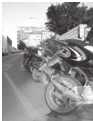
Motos estacionadas en el casco urbano