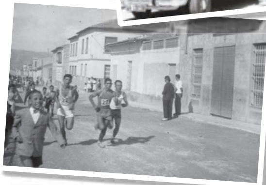
Any 1959 Carrera de camp a través celebrada amb motiu de les festes de la Mare de Déu del Remei, pel carrer Leopoldo Pardinez.