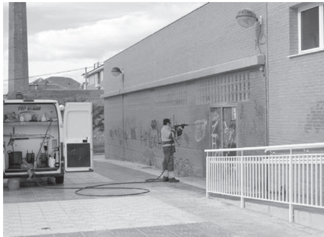
Imágenes de archivo. Operario de limpieza eliminando una pintada

Si tomamos como referencia los sectores económicos, el paro ha bajado en "Agricultura" con 162 para-