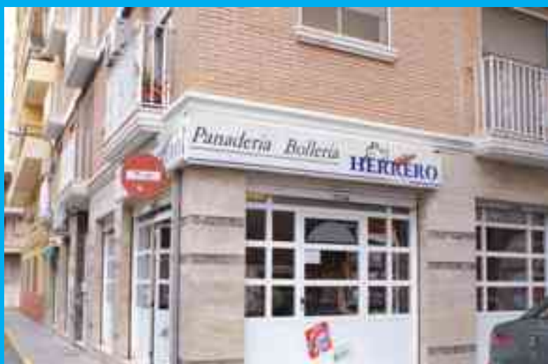
Panadería Bollería Herrero