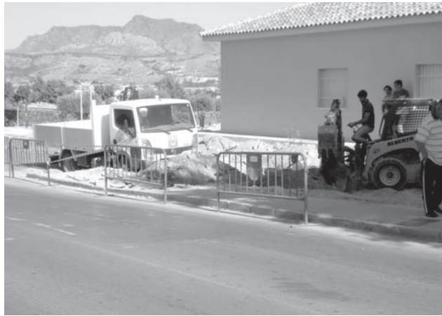
Obras en ejecución en la calle Norte

había comprometido a ejecutar una vez se subsanaran algunos impedimentos como el derribo de las casas de planta baja de la calle Norte, que se llevó a cabo a finales del año 2006, así como la construcción de una nueva sede para el Club Petanca y la demolición del antiguo local que se realizó hace unos tres meses. Asimismo, ha comentado que era una necesidad ejecutar estas obras puesto que ese tramo de la calle suponía un peligro tanto para los peatones como