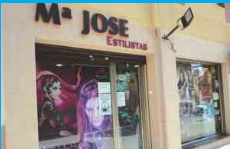
María José Estilistas