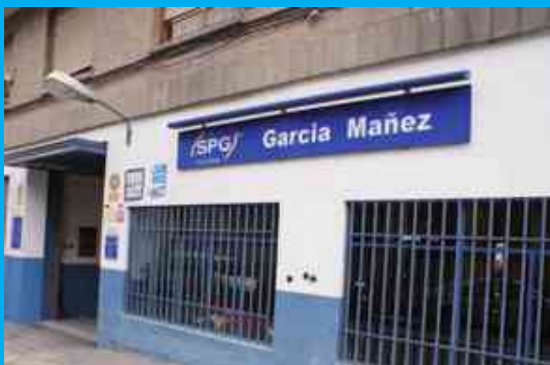
Talleres García Máñez