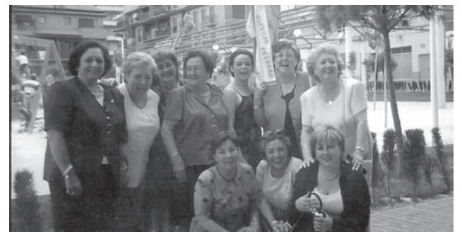
Jandri junto a familiares y la abanderada de los Labradores del 1999

"Cuando llegué a Ciudadella, la ciudad no me gustó nada, porque no había nada de vida"