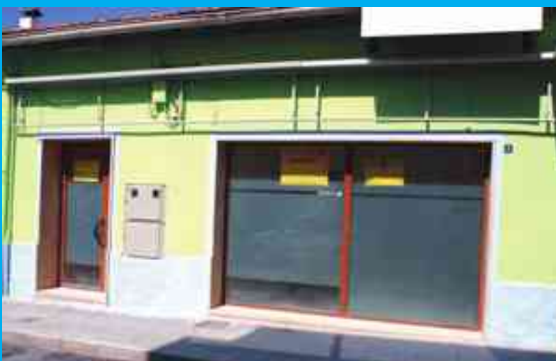
Guardería Els Angels