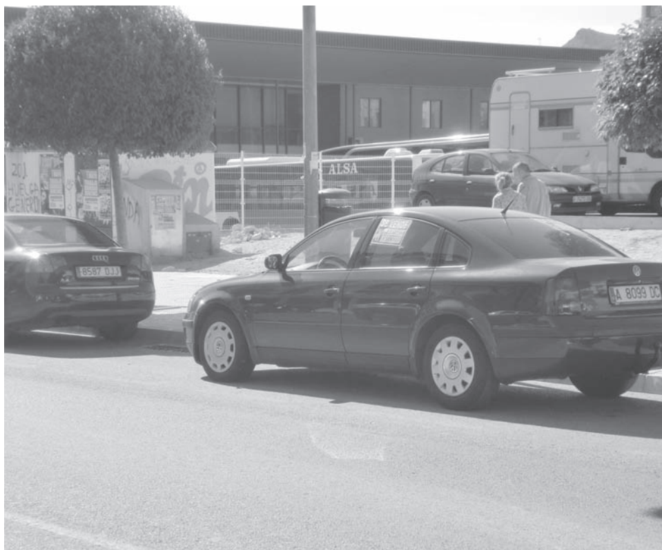
Vehículo, que se vende, aparcado durante semanas en la avenida Reina Sofía

riedad de la persona que recibe la llamada y, además, comprueba toda la documentación. En el caso de que no coincida teléfono y documentación con el propietario, la grúa retira el vehículo de la vía pública. Además, ha puntualizado que aunque la persona, que se dedica a comprar esos coches, esté dado de alta como autónomo no puede realizar esa actividad comercial en la calle porque, según sus propias palabras, "en Petrer está prohibida la venta ambulante y sólo se permite en espacios delimitado, como puede ser el mercadillo