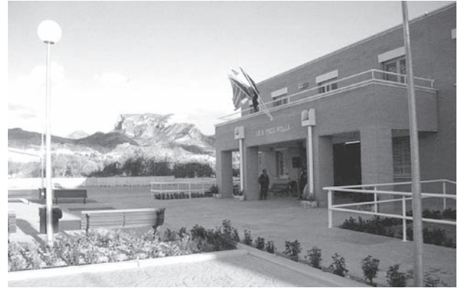
Imagen de archivo del Instituto Paco Mollá

Critican la reducción de grupos y el despido de profesores