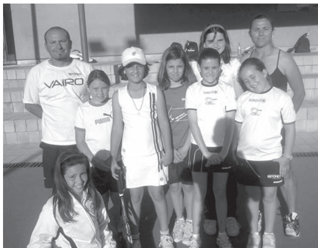
Equipo alevín femenino