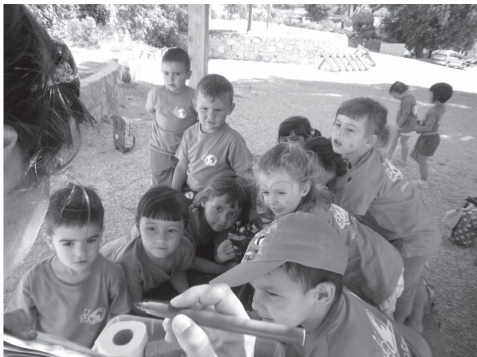
Escuela de Verano 2011