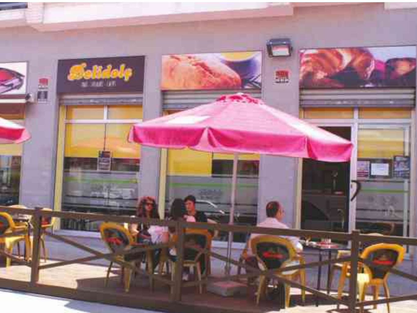
Una de las terrazas que ya cumple con la nueva normativa