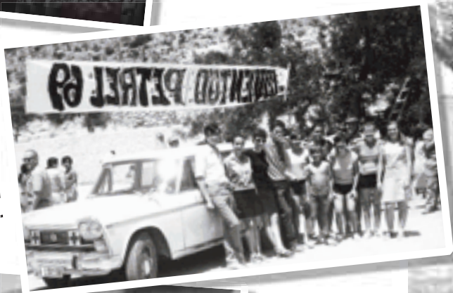
Any 1969 En la foto apareixen els participants en la Setmana de la Joventut de 1969, junt amb la primera ambulància de la Creu Roja Local.

Treballs de tala de pins en el que era el pati de recreació del col·legi Primo de Rivera quan encara albergava una important població escolar. Quan es va tallar l'arbratge els grups ecologistes van mostrar en reiterades vegades la seua protesta