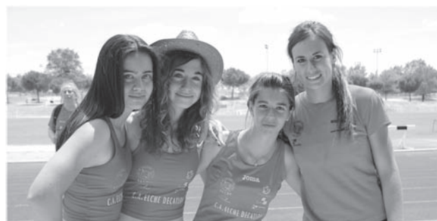
Las cuatro atletas de Petrer que competieron en Alcorcón

Competieron en las filas del Decatlon de Elche en el campeonato celebrado en Alcorcón