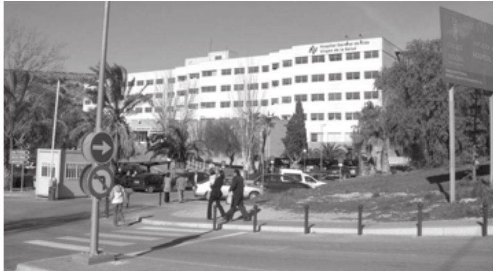
Los recortes en Sanidad fue una de las mociones en las que no hubo consenso. Imagen del Hospital General de Elda

Esta ordenanza trata de regularizar la instalación de terrazas y toldos además de normalizar la figura del Inspector de Aperturas a fin de velar por que esta ordenanza se cumpla. Las terrazas que se instalen en la calzada tendrán que estar sobre una tarima y un vallado específico para dar seguridad a los clientes que se acomodan