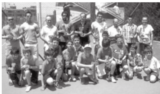
Finalistas II Open Dahellos