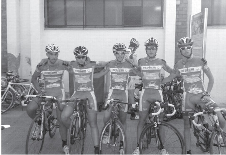
Club Ciclista Paco López