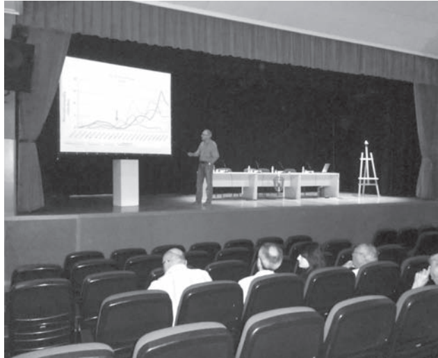
Jornada sobre el olivar y el almendro en el Centre Cultural