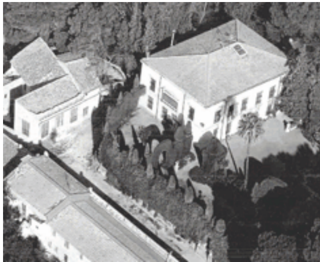
Imagen aérea del Poblet