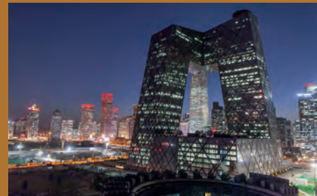
CONCURS DE RELATS JUVENIL 2019 EN LAS PÁGINAS INTERIORES