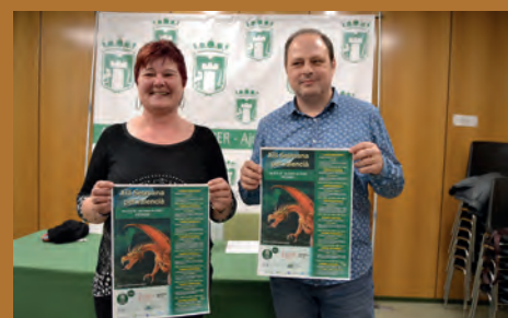
EN MARCHA LA "XIII SETMANA PEL VALENCIÀ" CON MÁS ACTIVIDADES