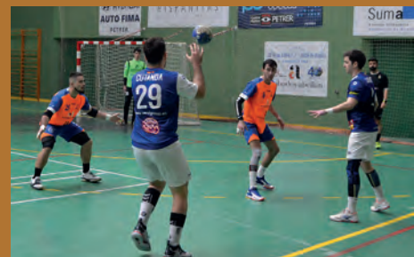
HISPANITAS PETRER RECIBE A MISLATA ESTE SÁBADO