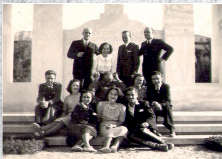
Anys 1950 Grup d'amics, entre ells els cosins Villaplana en la Creu dels Caiguts