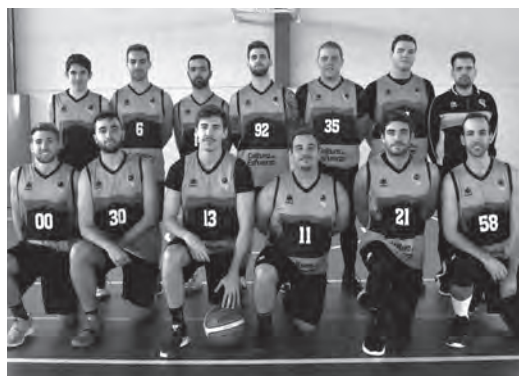
CB Petrer Sénior masculino

Derrota en casa para el sénior masculino ante El Pinós por 66-82 en un choque en el que les pasó factura el mal inicio que protagonizaron, confalta de tensión y encajando un parcial de 0-12. Esa distancia en el marcador se mantuvo durante toda la primera mitad que se cerró con los petrerenses nueve puntos abajo. Durante el resto del partido intentaron reducir la ventaja pero el los pinoseros, poco a poco, se marcha en el marcador hasta sellar una victoria merecida.