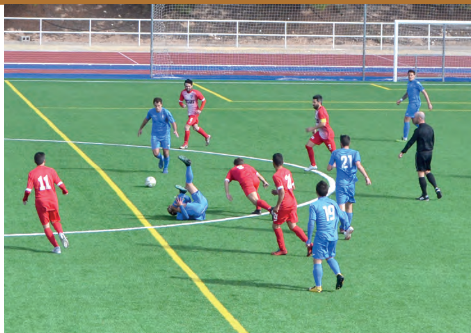
El Petrelense no pudo con el Redován