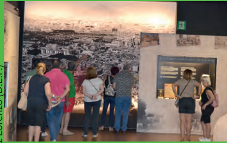
LAS JORNADAS DEL PATRIMONIO SERÁN ESTE FIN DE SEMANA