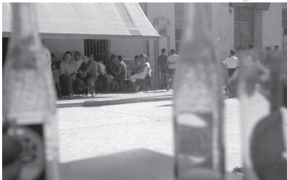
Terraza del bar "Chico de la Blusa" en el paseo de la Explanada, un domingo de aperitivos