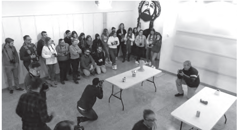
Imagen de archivo de una de las ediciones del Curso.