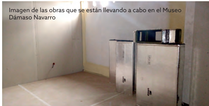
Imagen de las obras que se están llevando a cabo en el Museo Dámaso Navarro

Esta actuación, que cuentan con un presupuesto de 130.000 euros financiados