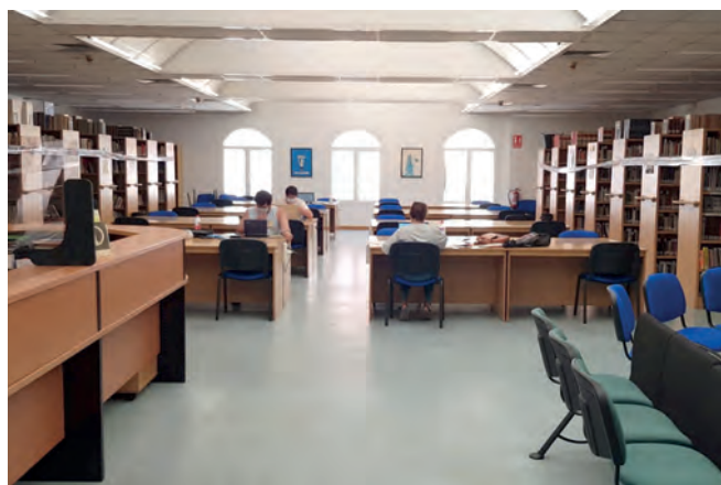
Imagen de la biblioteca Paco Mollá

En el caso de la de "Paco Mollá", permanecerá abierta al público de lunes a viernes, de 10:30 a 13:00 horas y de 16:00 a 20:30 horas. Mientras que la de "Enrique Amat", el horario va a ser de lunes a viernes, de 10:00 a 13:30h y de 16:30 a 20:30h.