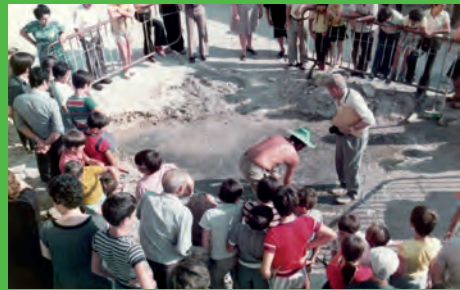
SOM DE PETRER: EL MOSAICO DE PETRER. UNA JOYA ROMANA