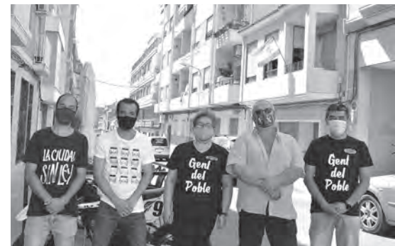
Directivos de la asociación