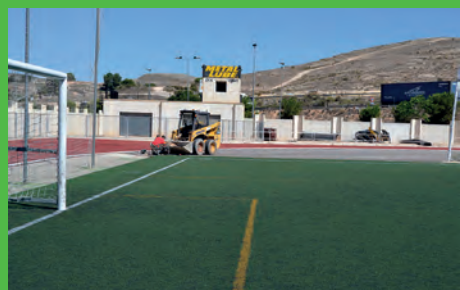
EL PP PIDE A DEPORTES MÁS MANTENIMIENTO EN EL BARXELL