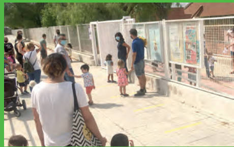
NORMALIDAD EN EL INICIO DEL CURSO ESCOLAR