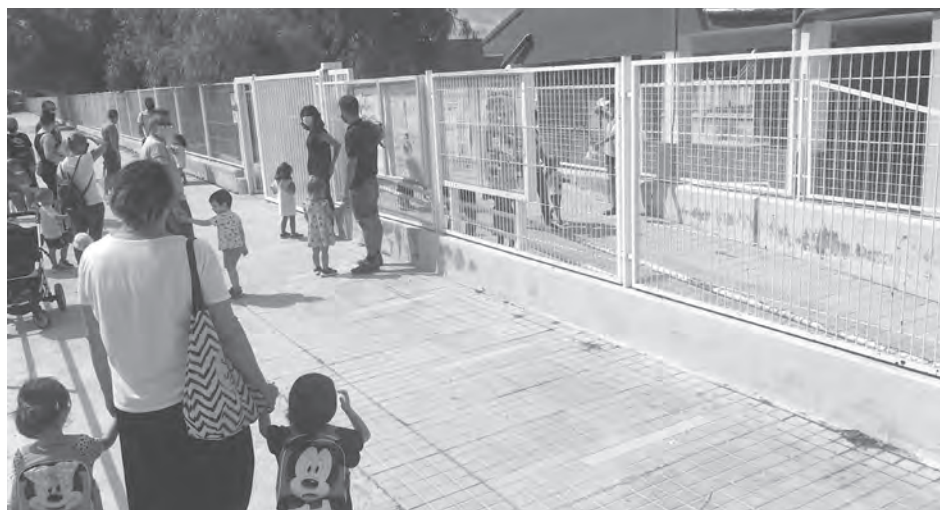
Imagen del inicio del curso escolar en un colegio de Petrer

La administración autonómica ha dotado 21 plazas más de personal docente, ha incrementado en más de 104.000 euros los gastos de funcionamiento para atender las nuevas necesidades para cumplir con los planes de contingencia de los centros y casi 70.000 euros para la programación de actividades extraescolares. Mientras que el Ayuntamiento de Petrer, aprovechando los meses de verano, ha realizado obras y mejoras en los centros por un im-