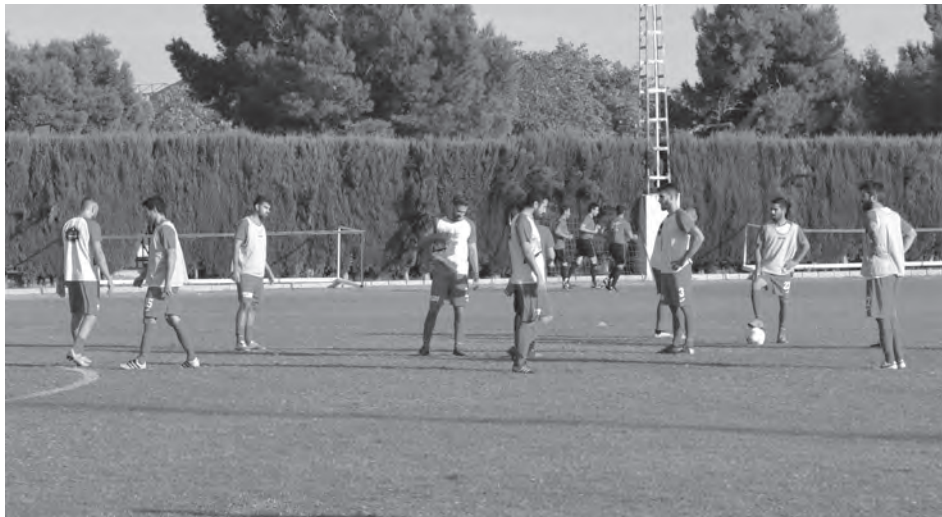
Los partidos de pretemporada darán inicio este sábado en Aspe

El primer enfrentamiento será el sábado 12 de septiembre contra el Aspe en "Las Fuentes", le seguirá el Novelda UD el sábado 19 de septiembre en "La Magdalena", a continuación se rendirá visita al Villena en "La Solana" el viernes 25 de septiembre, luego tocará jugar contra el Sax en el Municipal "El Pardo", seguirá el comentado choque en Petrer ante la U.A., para terminar