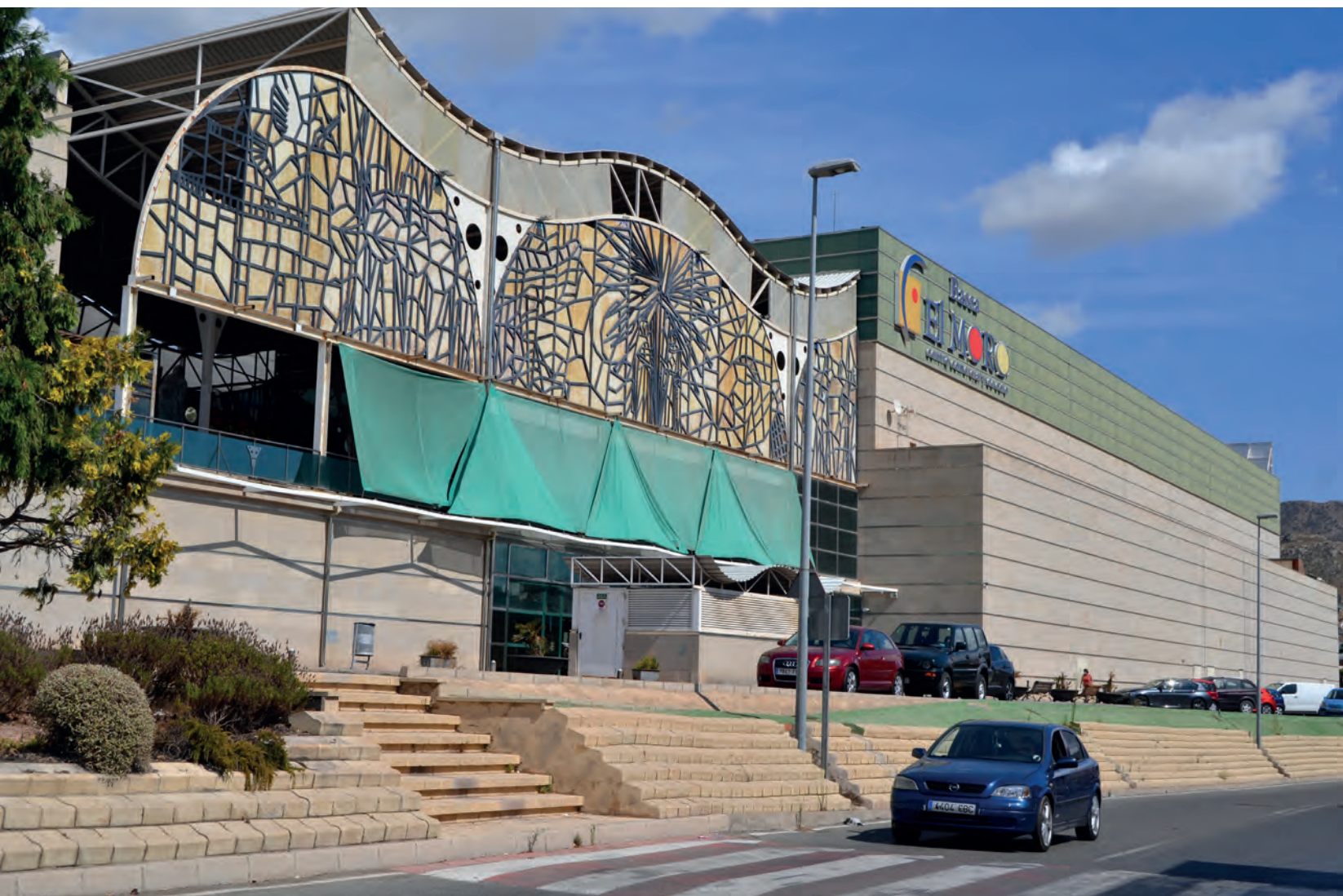
Fachada del centro comercial Bassa el Moro

El grupo Hipoges adquiere el 100% del centro comercial Bassa el Moro en el que invertirá más de 10 millones de euros para reactivar su tejido comercial que había tocado fondo con el 30% de ocupación del recinto.