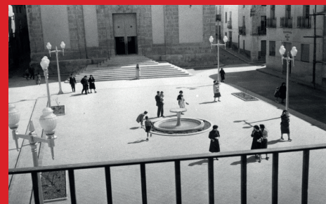
SOM DE PETRER: LES FONTS DE LA PLAÇA DE BAIX