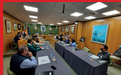
APROBADOS LOS PRESUPUESTOS MUNICIPALES DEL AÑO 2022