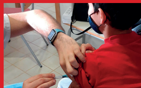
LA PRIMERA FASE DE LA VACUNACIÓN INFANTIL, UN ÉXITO