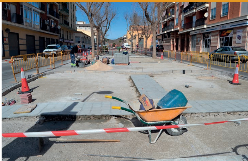
Bulevar de la Avenida Felipe V