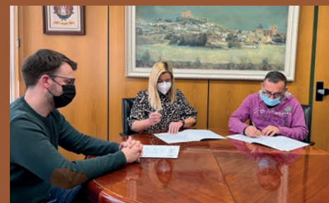
AYUNTAMIENTO Y ARTENBITRIR FIRMAN EL CONVENIO PARA 2022