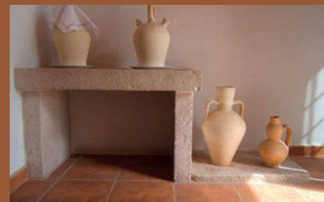
SOM DE PETRER: EL CANTERER: L'AIGUA EN LES CASES