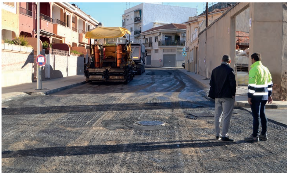
Calle Isla Trinidad

decidido asfaltar las vías más transitadas y que presentaban una capa asfáltica en peores condiciones.