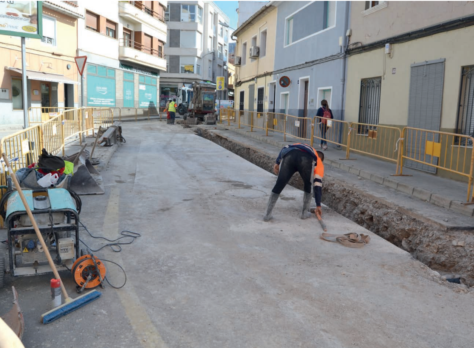
Calle Joaquín Poveda

Reformar o remodelar las calles y avenidas de un municipio siempre ocasionan molestias a los residentes y comerciantes de las vías en las que se actúa, al tráfico rodado e, incluso, a los peatones. Pero son unas molestias que la ciudadanía debe de llevar lo mejor posible si quiere un municipio accesible y acorde a los tiempos que corren.