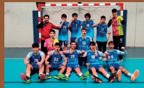
EL CADETE DE HISPANITAS PETRER, CAMPEÓN DE PREFERENTE