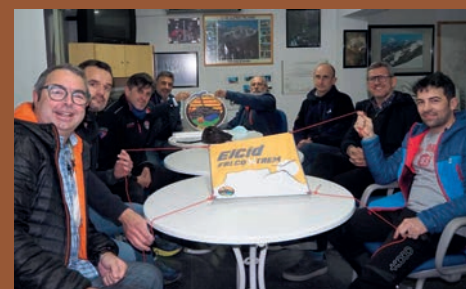
EL CIDFALCOEXTREME CONTARÁ CON UNA SEGUNDA EDICIÓ