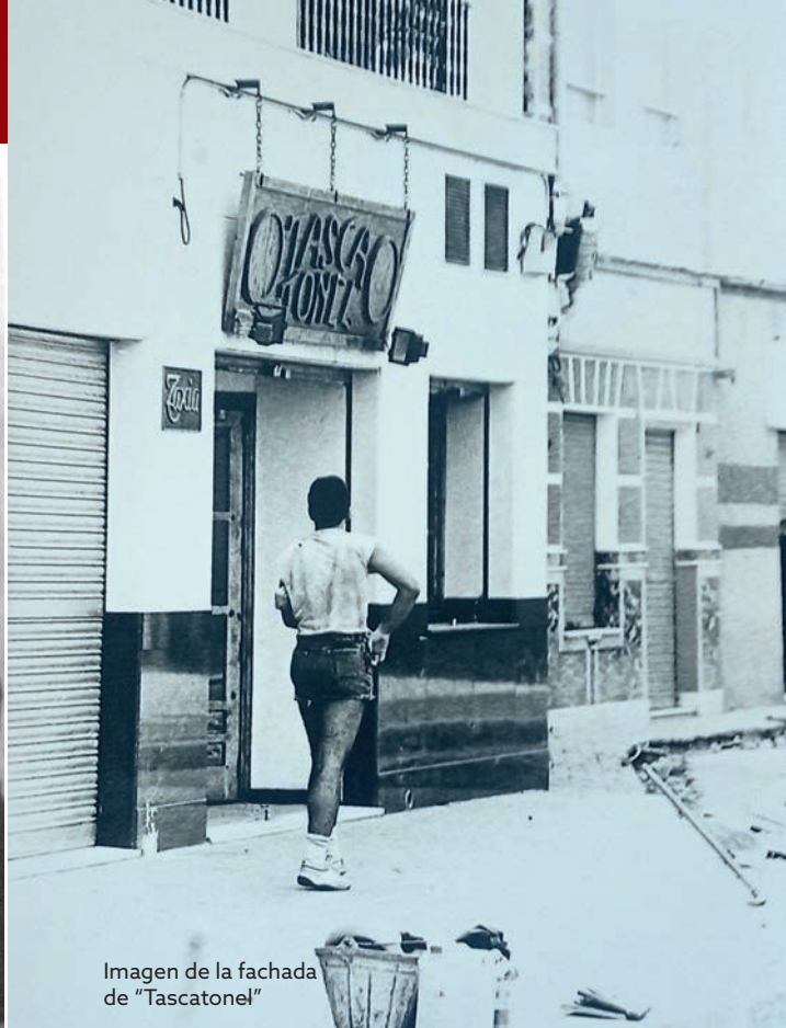
Imagen de la fachada de "Tascatone!"