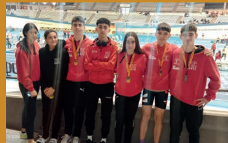
5 MEDALLAS PARA EL CAPET EN EL AUTONÓMICO SUB-18