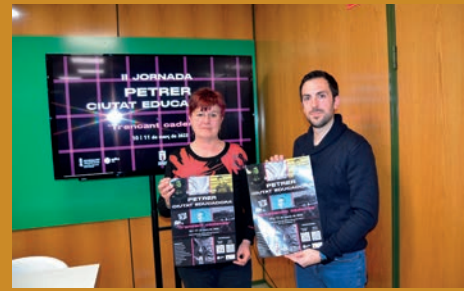
EN MARCHA LAS JORNADAS: PETRER, CIUDAD EDUCADORA