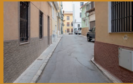
SOM DE PETRER: PEDRO REQUENA: EL LATIR DE UNA CALLE (II)