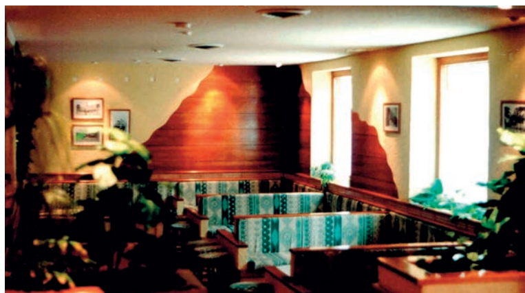
Interior del pub "Country"