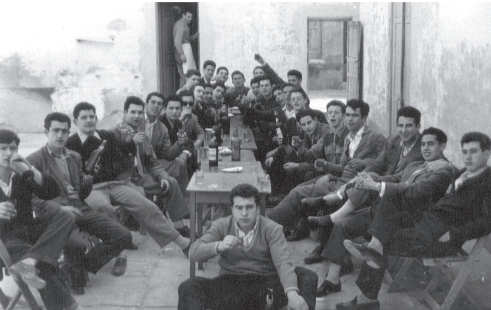
En la patio interior del "Chiqui"