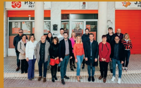
EL PSOE PRESENTA SU LISTA ELECTORAL PARA EL 28-M