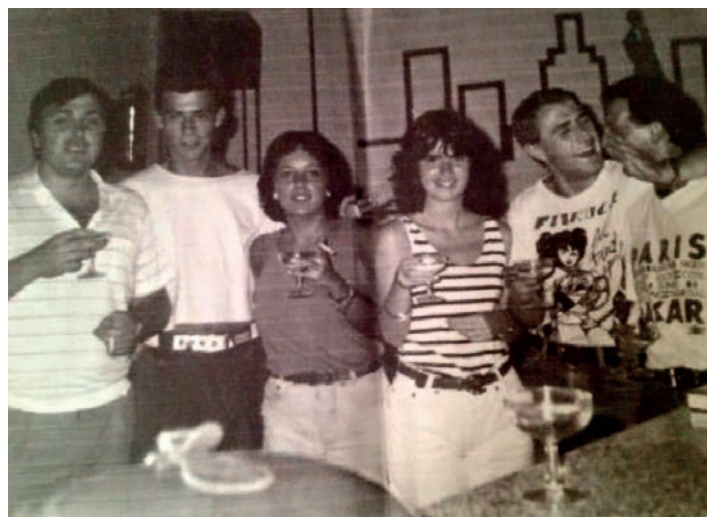
Grupo de amigos en el interior de "Metropol"

deo", entre ellos, "Músic", "Caché", "El Racó" y "Play". A estos establecimientos, cabría la posibilidad de que se sumarán nuevos locales, aunque, tal y como están las cosas, invertir es correr un riesgo, o bien que alguna que otra cafetería que está en activo se adaptara a la filosofía del "tardeo". El tiempo lo dirá, mientras tanto, Petrer, seguirá sin disfrutar de esta nueva moda de ocio.