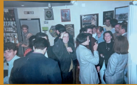
ESTE POBLE: ÉPOCA DORADA DE OCIO Y "TARDEO" EN PETRER