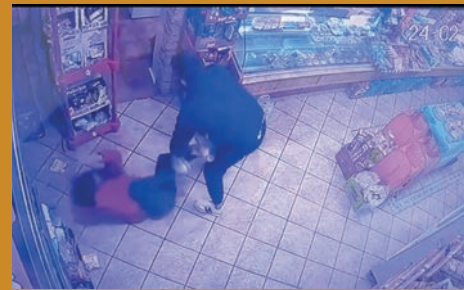
BRUTAL AGRESIÓN A UNA DEPENDIENTA EN UN COMERCIO DE PETRER