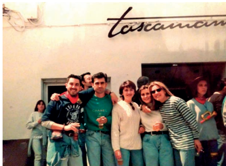
Diferentes imágenes del interior y del exterior del pub "Tascamañía"