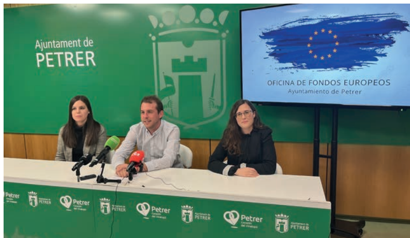
Imagen de la presentación de la Oficina de Captación de Fondos Europeos

El edil ha recordado que estas ayudas económicas ofrecidas por la Unión Europea (UE) a través de diferentes programas y fondos, tienen múltiples beneficios para los beneficiarios y la sociedad en general. Las subvenciones europeas permiten financiar proyectos que de otra forma serían difícilmente viables, especialmente