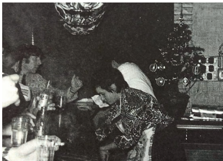
Imagen de la barra del "Chiqui"