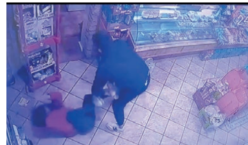
Captura de pantalla del vídeo de seguridad del comercio viralizado por las redes sociales

El pasado fin de semana, concretamente durante la noche del miércoles 24 de febrero, tuvo lugar una brutal agresión en un comercio de la calle Dámaso Navarro en la que un varón arrastró y golpeó, salvajemente, con una barra de hierro en repetidas ocasiones