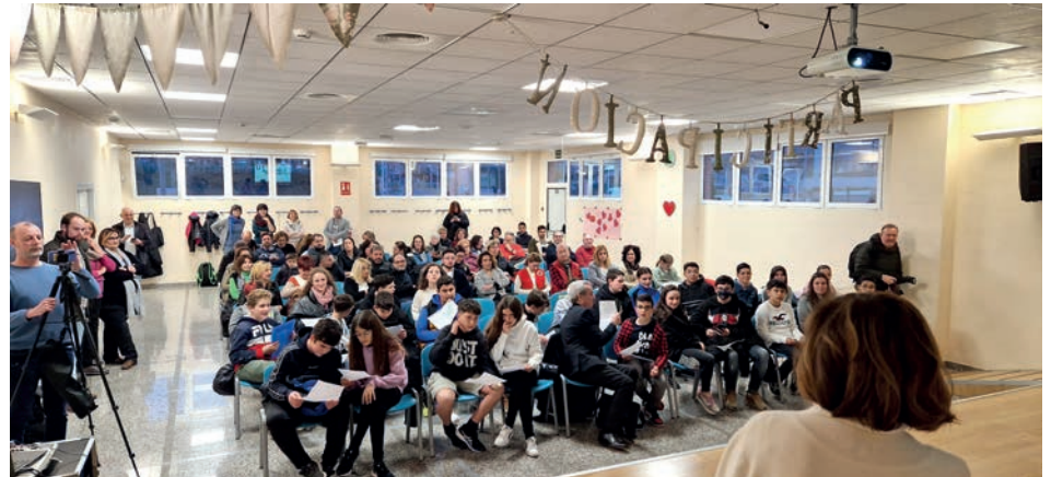
Imagen del acto de clausura

Cabe recordar que el pasado viernes 3 de marzo, en el Parque El Campet, tuvo lugar una jornada extraescolar lúdico educativa en la que participaron todos los centros escolares del municipio y en la que el