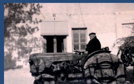
ESTE POBLE: LA CASA CORTÉS, 300 AÑOS DE HISTORIA