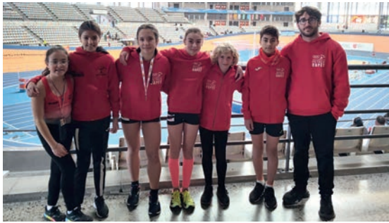
Gran actuación de los jóvenes atletas

El Club Atletismo Petrer Capet se trajo tres medallas en el autonómico sub 16 que tuvo