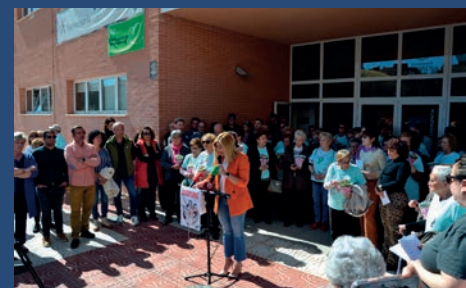
PETRER CELEBRA Y CONMEMORA UN AÑO MÁS, EL 8-M