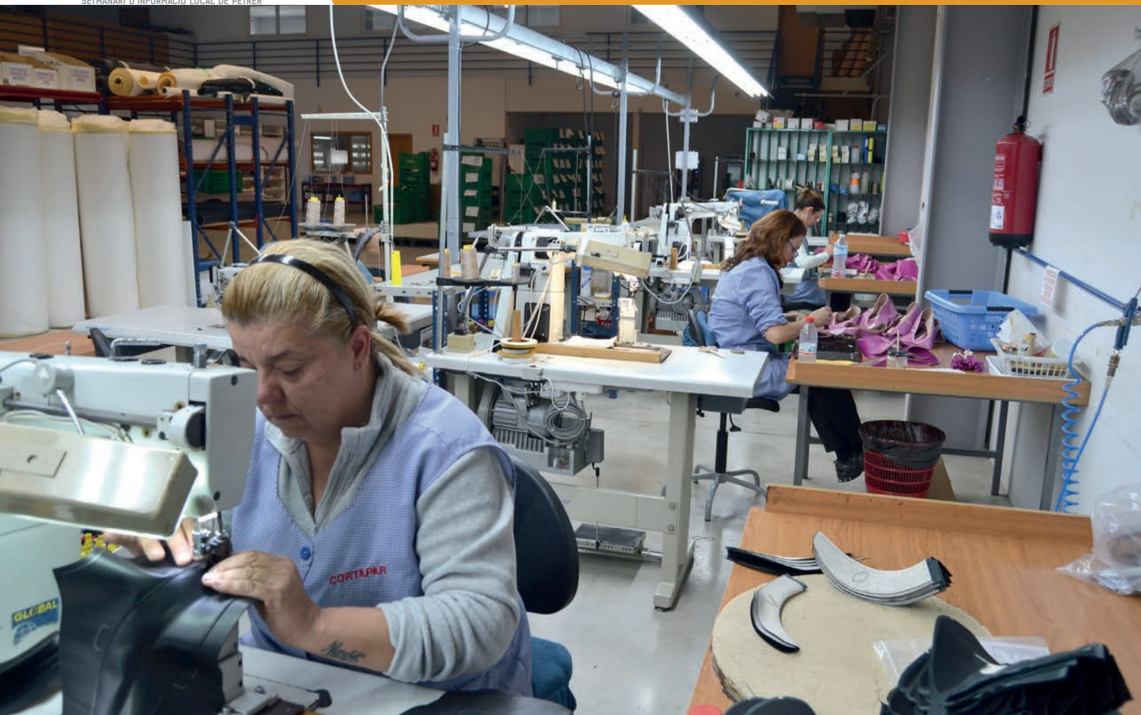
Fotografías realizadas en la empresa de calzado "Cortapar, S.L.U."