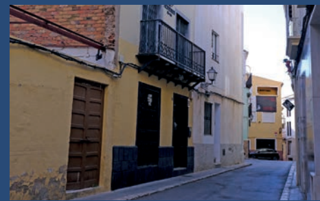
SOM DE PETRER: PEDRO REQUENA: EL LATIR DE UNA CALLE (II)