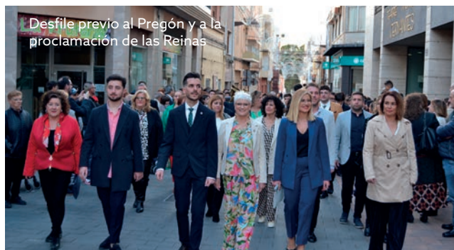
Desfile previo al Pregón y a la proclamación de las Reinas