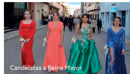
Candidatas a Reina Mayor