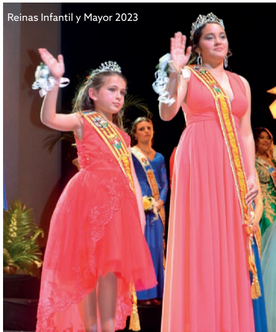
Reinas Infantil y Mayor 2023