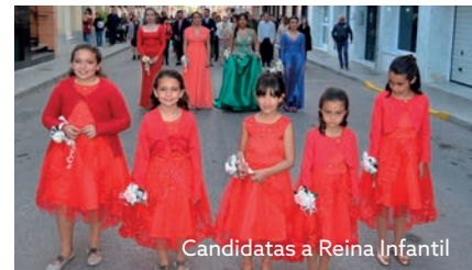
Candidatas a Reina Infantil