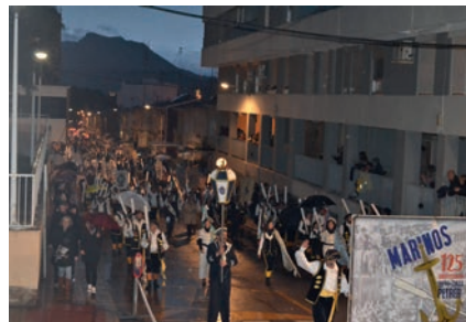
Desfile del 125 Aniversario de los Marinos