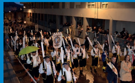
REPORTATGE: EL TIMÓN DE LOS MARINOS