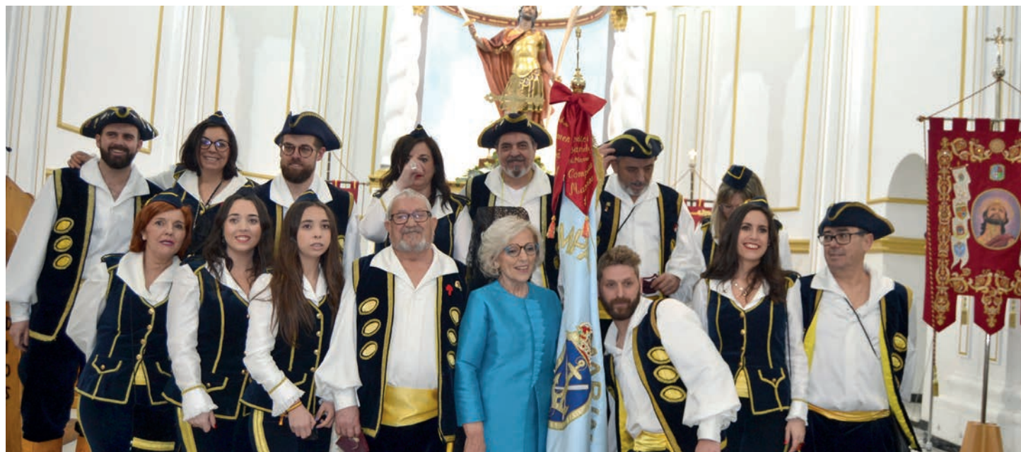
26 de marzo de 2022