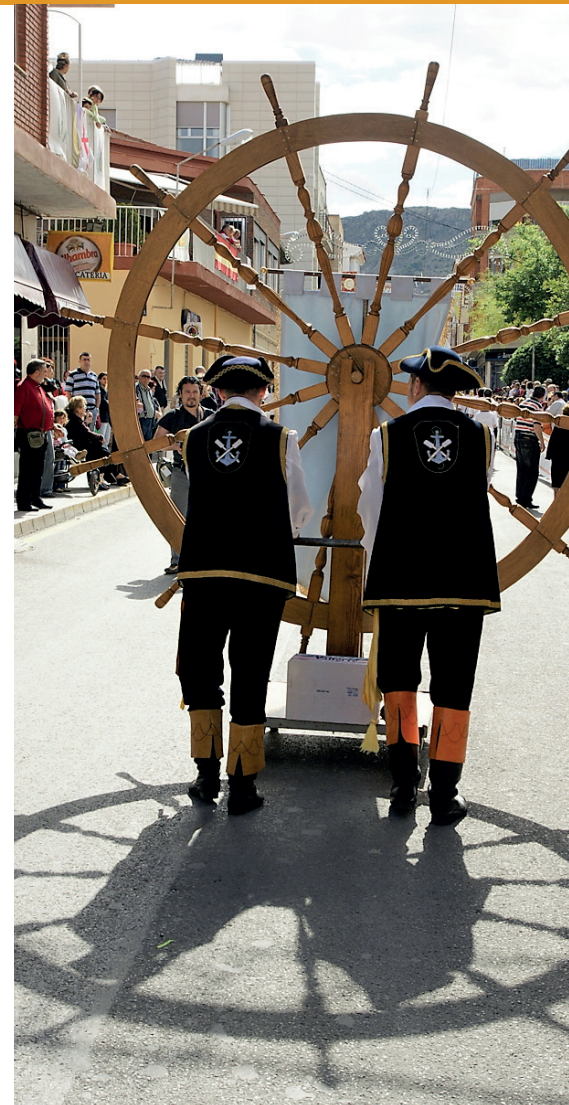
El timón de los Marinos

San Bonifacio". Un CD que, con honres aporta el pasodoble Petrel . Obra carismática de Miguel Villar González (Port de Sagunt, 1913-Gandia, 1996). Se estrenó como colofón a la Entrada de Músicas de 1969, y según el corresponsal local "Tadeo":