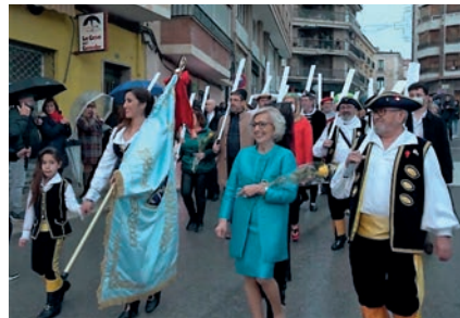
Desfile Conmemorativo del 125 Aniversario de los Marinos