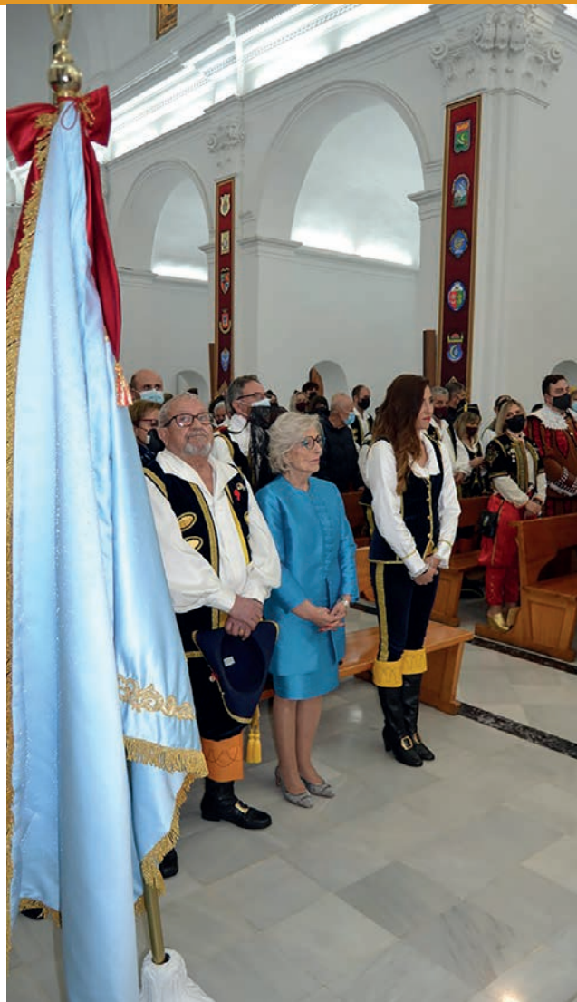
26 de marzo de 2022