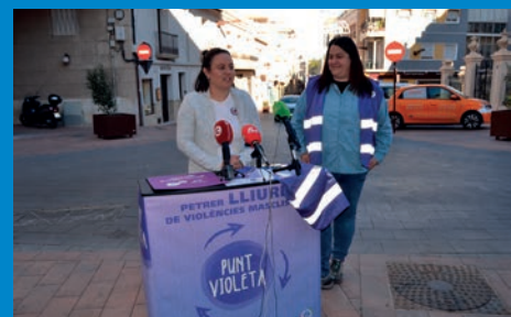
IGUALDAD INSTALARÁ UN PUNTO VIOLETA EL DÍA DE BANDERAS