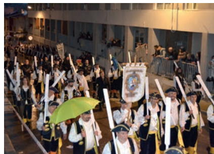
Los Marinos y el Gran Desfile