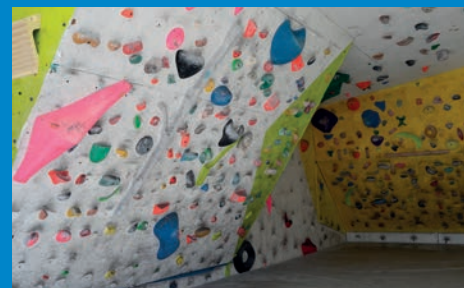
DEPORTES AMPLÍA EL ROCÓDROMO DEL POLIDEPORTIVO SAN FERNANDO