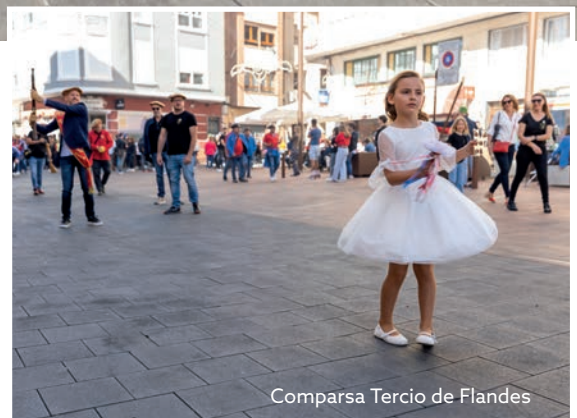
Comparsa Tercio de Flandes