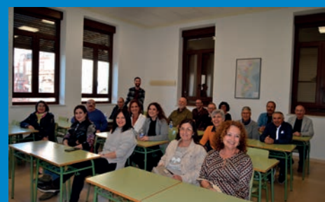
ESTE POBLE: EPA CARLES SALVADOR, UN ESPACIO DE FORMACIÓ I SOCIALITZACIÓ