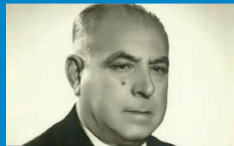
SOM DE PETRER: EL ALCALDE MÁS LONGEVO