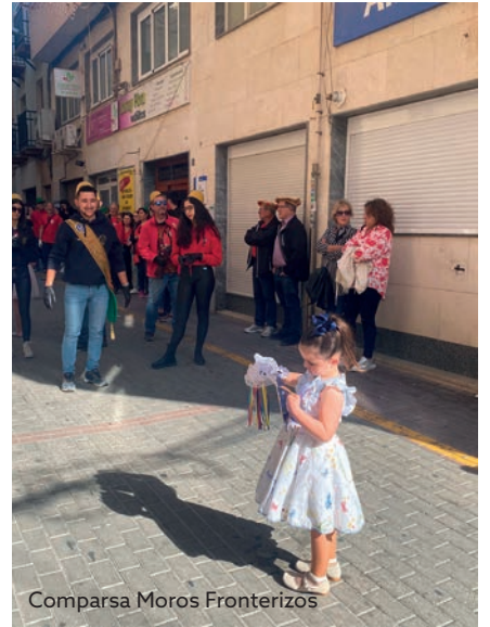
Comparsa Moros Fronterizos