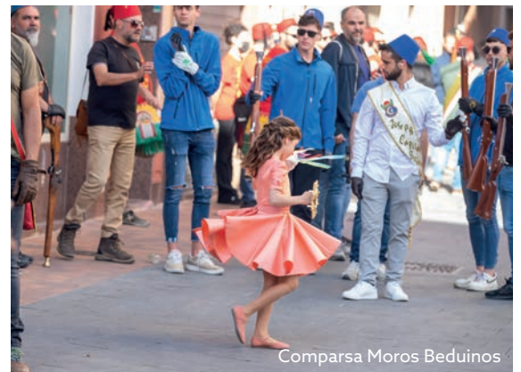
Comparsa Moros Beduinos