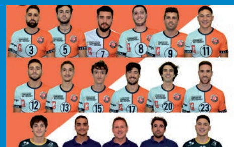
CABLEWORLD VILLENA-PETRER BUSCA EL ASCENSO A SUPERLIGA