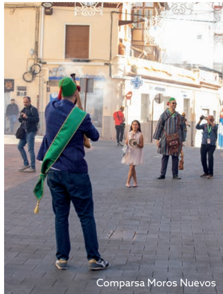
Comparsa Moros Nuevos