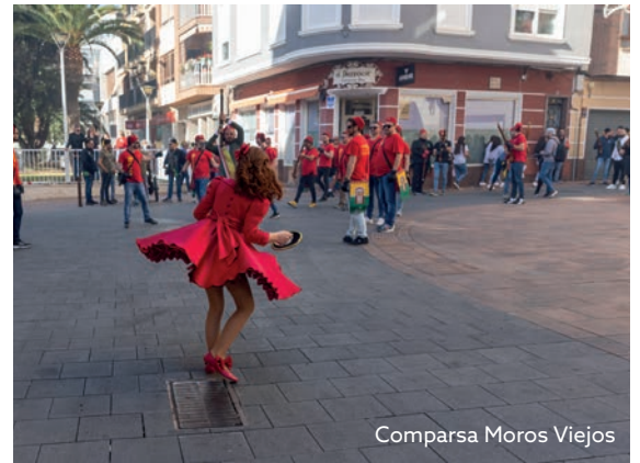
Comparsa Moros Viejos