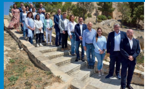
EL PP PRESENTA LA LISTA ELECTORAL PARA LAS MUNICIPALES