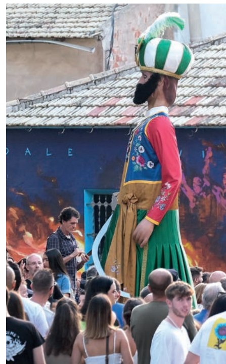
El gegant moro vell, representa al tio Pajuso

Ànima Festera. Los Capítulos de la Hermandad, es el primer documento o reglamento festero que poseemos: convive con la soldadesca con moros y cristianos, con los tambores y con el músico, con la presencia del Embajador, con los refrescos a los tiradores o con el olor a pólvora. Y en tan memorable tarde (17.09.2022), en un desfile notable, la comparsa desplegó su simbología, con sus intensos colores y sabores de la fiesta. Con una aper-