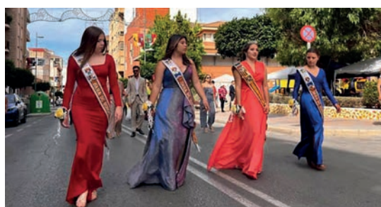
Reina Mayor y Damas de Honor

Cabe recordar que al Pregón, Elección y Coronación de las Reinas Mayor e Infantil de 2023 y Almuerzo Popular, le han seguido varias actividades durante el pasado fin de sema-