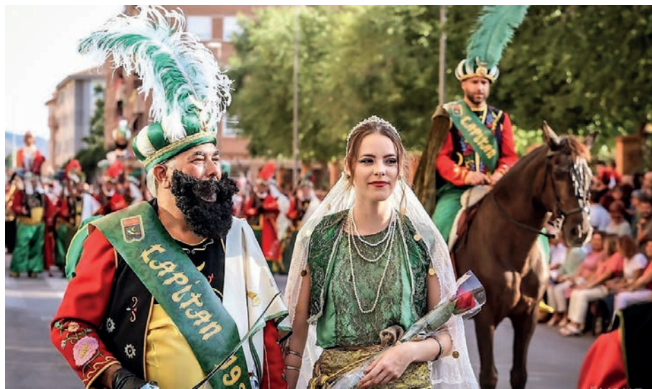
El Gran Desfile Moro. 17.09.2022