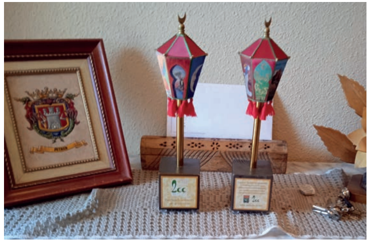
Cultura en Bitrir