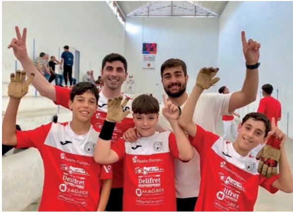
Los alevines de Petrer se meten en la final provincial de Raspall