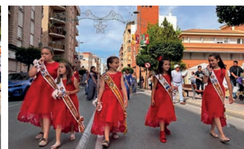
Reina Infantil y Damas de Honor

na, entre ellas la actuación infantil del Payaso Edy que dio paso a una Cena de Sobaquillo y, posteriormente, a la elaboración de la Cruz de Flores, en la jornada del viernes. Mientras que el sábado comenzó con el Pasacalle de la Ofrenda de Flores por distintas calles del barrio La Frontera para concluir en la Iglesia de la Santa Cruz. Ese mismo día, por la tarde, se llevó a cabo la esperada Cabalgata por la avenida de Madrid, cerrando con la Verbena Popular amenizada por un