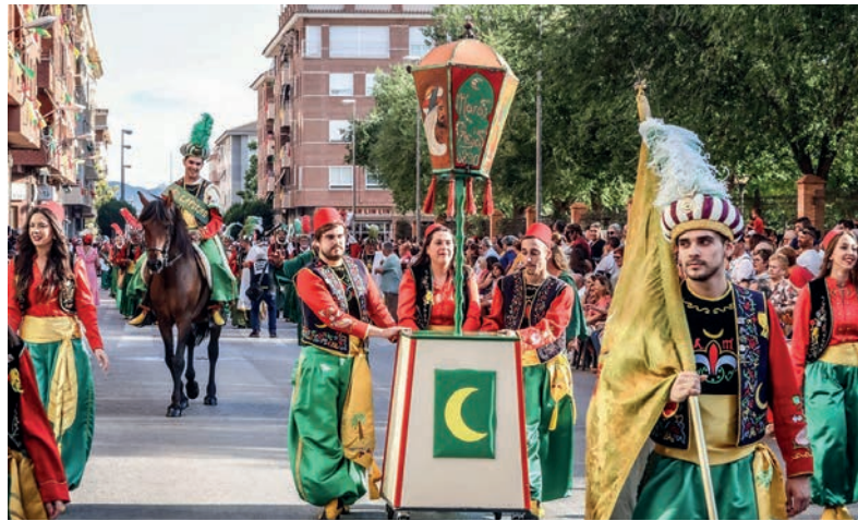
La desfilada a través de l'Història