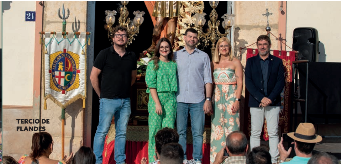
TERCIO DE FLANDES