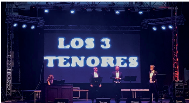
Imagen de una actuación de "Los 3 tenores"