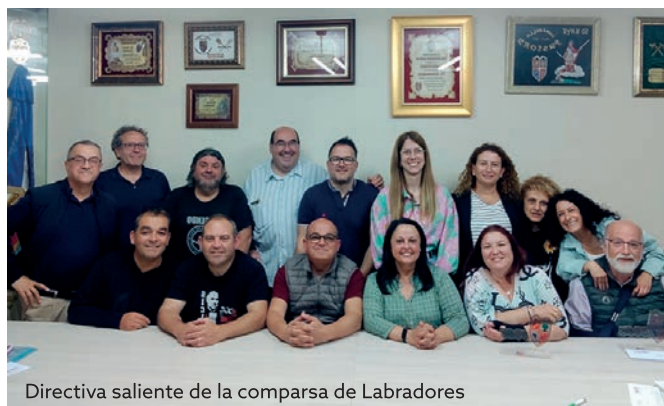
Directiva saliente de la comparsa de Labradores