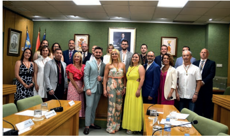
Imagen de la constitución de la nueva corporación municipal