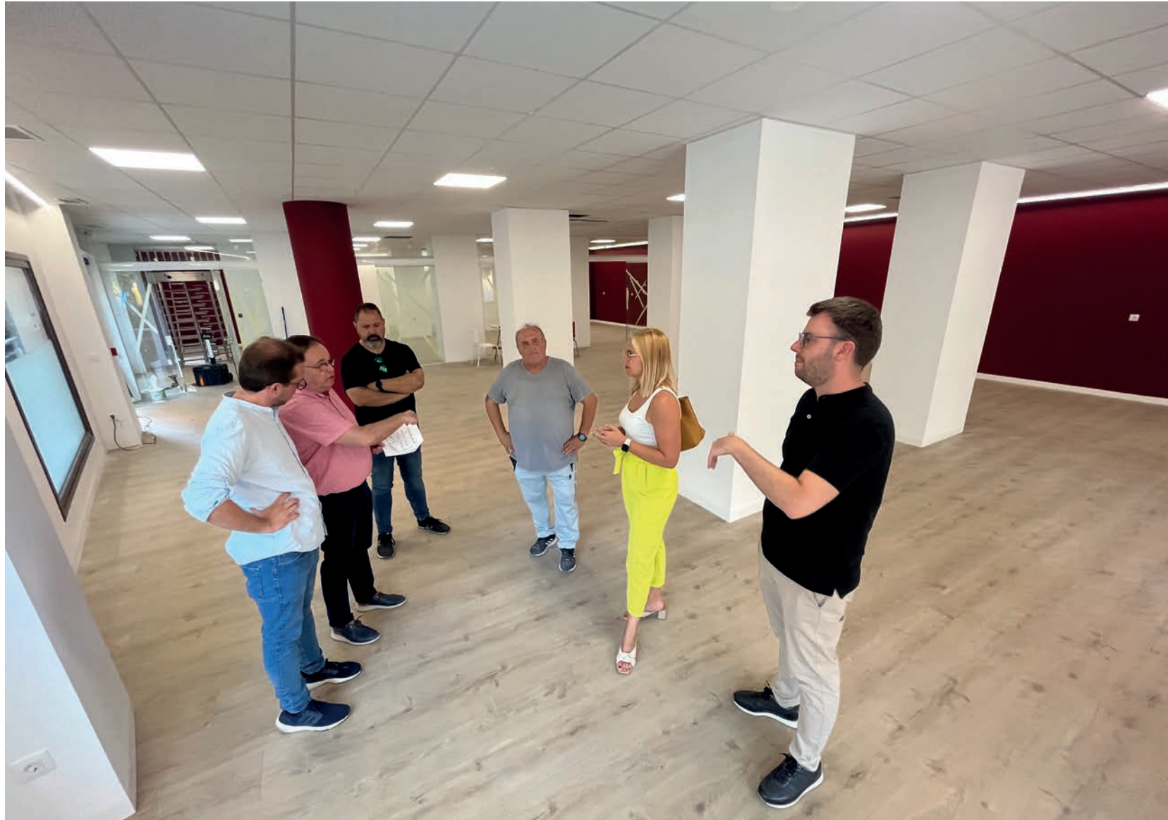
La Alcaldesa, el concejal de Urbanismo y el concejal de Cultura en la una de las salas de estudios junto a técnicos municipales

va a contar con un total de 91 plazas, distribuidas en dos aulas, una de 171m 2 , con capacidad para 58 y la otra de 103m 2 , para 33 personas, así como con un par de aseos, totalmente nuevos, uno para mujeres y discapacitados y el otro para hombres.