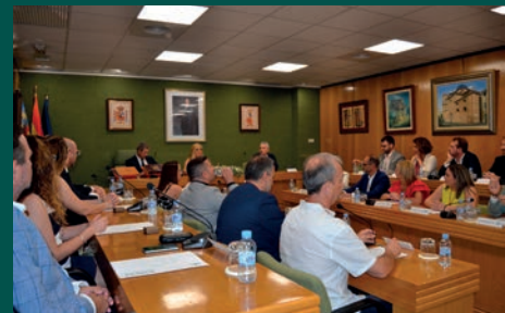
DESIGNADAS LAS LIBERACIONES PARA LA CORPORACIÓN MUNICIPAL