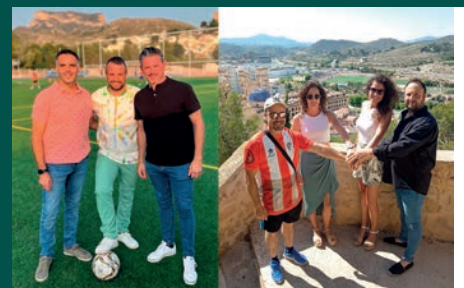
DOS CANDIDATURAS PARA PRESIDIR LA UD. PETRELENSE