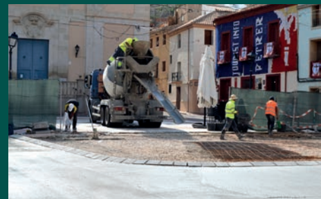
LA PLAÇA DE BAIX RECUPERARÀ EL TRÀFIC RODADO HABITUAL