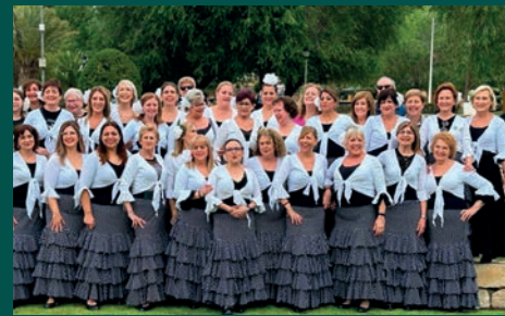
ESTE POBLE: "ARSA LA GUASA Y OLÉ"