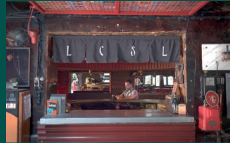
DIÀLEGS AMB...: EMMANUEL CIENMANDRÁGORAS