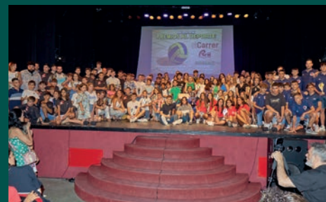
LLUVIA DE CANDIDATURAS PARA LOS PREMIOS AL DEPORTE