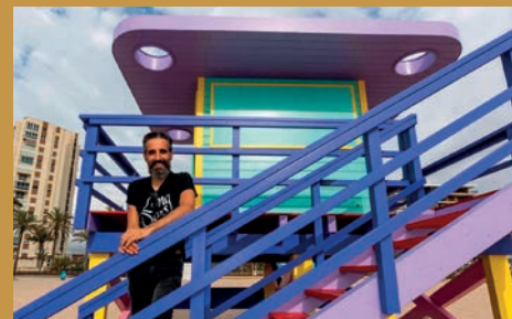
ESTE POBLE: UNA EBANISTERIA DE PETRER CONSTRUE LAS "TORRES DE SOCORRISTAS" DE SAN JUAN