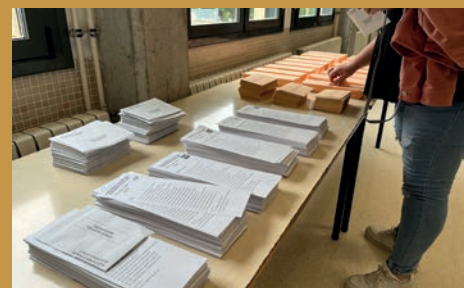
27.253 PETRERENSES PODRÁN VOTAR EN LAS GENERALES