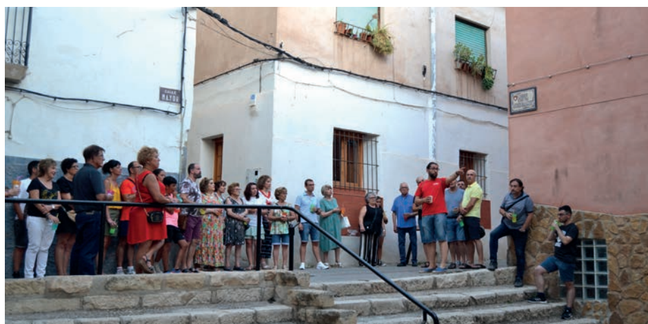
"Petrer, curiosidades con agualimón"

Un éxito sin precedentes comparándolo con el estreno de otras ofertas turísticas. Prueba de ello es que, en menos de 48 horas, tras haberla presentando y de abrir