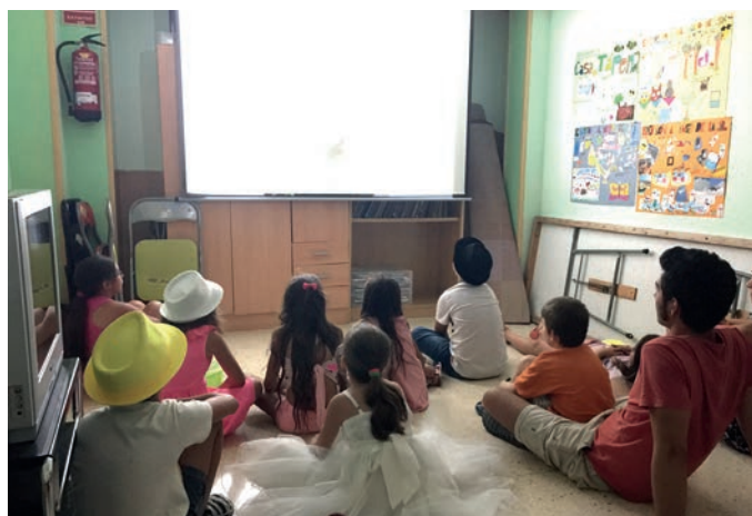
Imagen de archivo. Año 2015

El Centro de Día de Menores cambia de actividades y ofrece a los menores usuarios una rutina más veraniega y divertida hasta final de mes