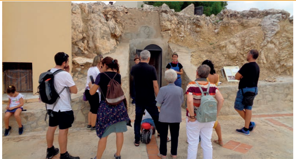
"Petrer, Ciudad sin Ley"

Como es una ruta circular, el punto de partida y llegada es la Tourist Info, comenzando a las 10:15 horas. Cuenta con ocho