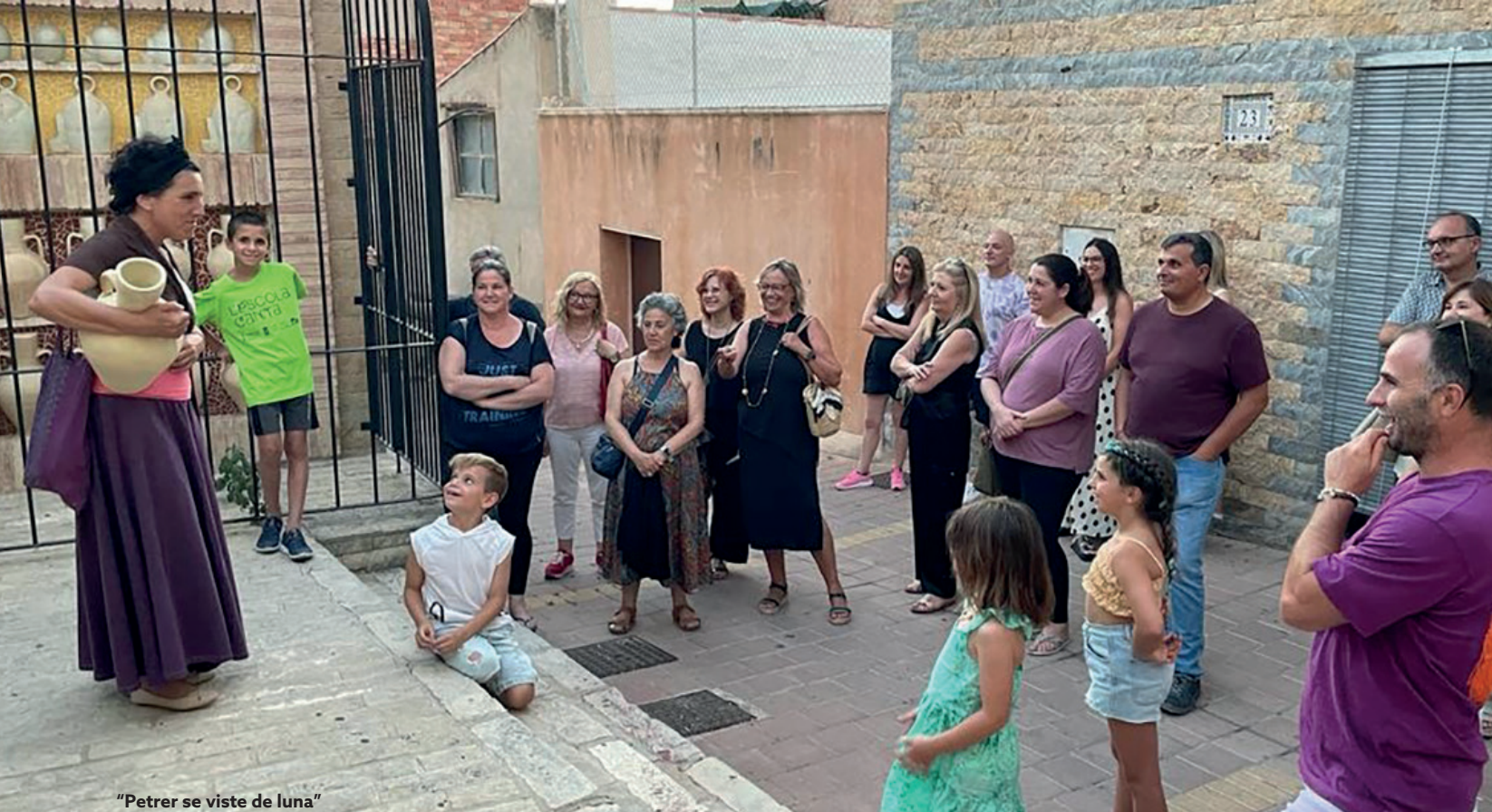
"Petrer se viste de luna"