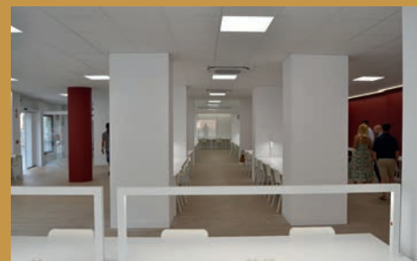
LOS CÓDIGOS DE LA SALA 24H SE PODRÁN SOLICITAR EL 24-J