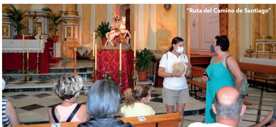
"Ruta del Camino de Santiago"

Por último, recordar que, para participar en cualquiera de estas rutas, aunque sean gratuitas, es imprescindible inscribirse, previamente, bien llamando al número de teléfono de la Tourist Info, 96/698.94.01, por WhatsApp al número 678.061.419 o bien enviando un mensaje privado a las cuentas oficiales de sus redes sociales: Facebook e Instagram.