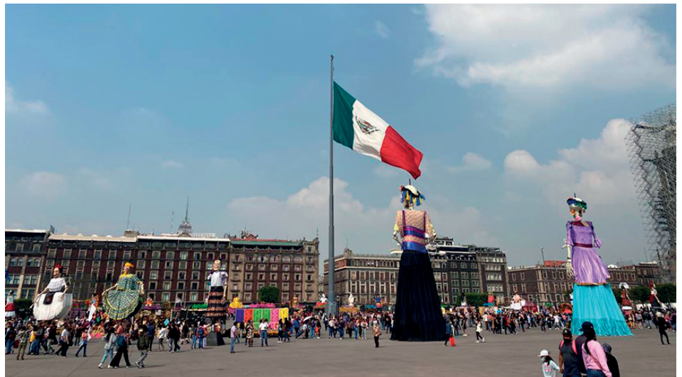
Imagen de una populosa plaza de la ciudad de León del estado de Guanajuato

A pesar de esos cambios, mi intención es seguir con ellos y jubilarme en la empresa por la que yo decidí hace ya casi 18 años dejar Petrer y establecer mi residencia en la ciudad