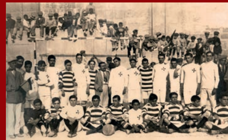
SOM DE PETRER: ¡CHUTA Y GOOOOL! EL FÚTBOL EN PETRER