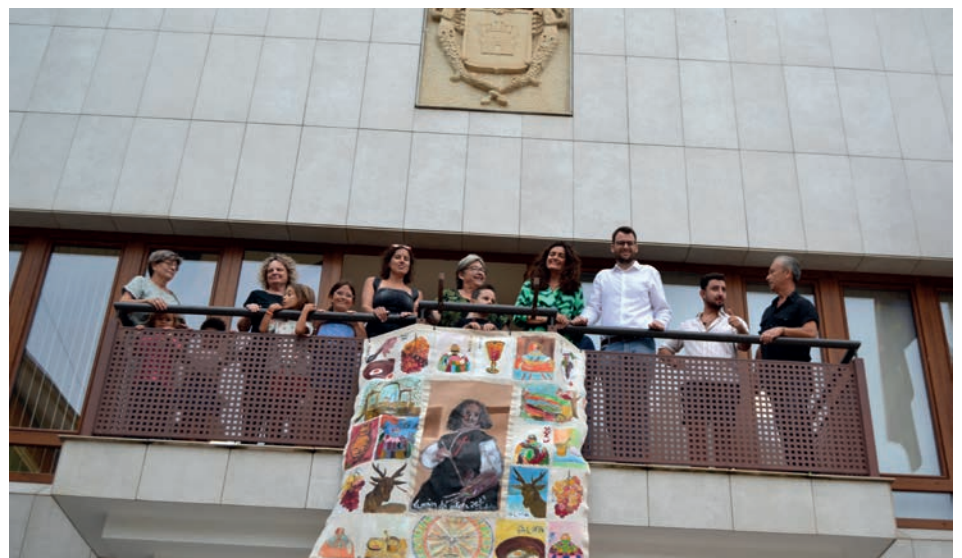
Imagen del lienzo colgado en el balcón del Ayuntamiento

El lienzo que se colgó en el balcón del Ayuntamiento fue elaborado por los niños de la localidad que quisieron participar en una actividad de pintura colectiva que, en esta ocasión, estuvo