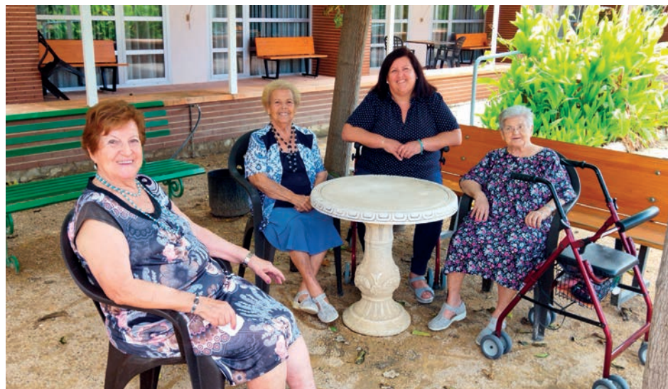
La directora y varias residentes, en los jardines interiores de la instalación

Ya han pasado 20 años desde que la Residencia La Molineta abrió sus puertas para acoger a su primer residente. Desde entonces, y a pesar de algún contratiempo que otro, ha prestado su servicio a cerca de 1.000 usuarios, entre residencia y Centro de Día