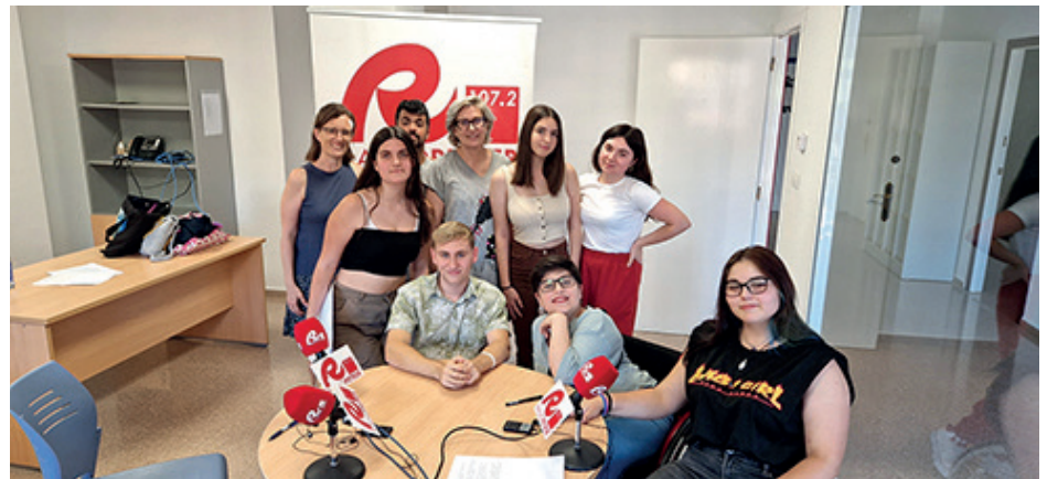
Imagen de archivo del programa de Radio Petrer, "Radio Jove"