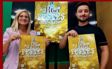
PRESENTADOS EL CARTEL Y EL SPOT DE LAS FIESTAS PATRONALES