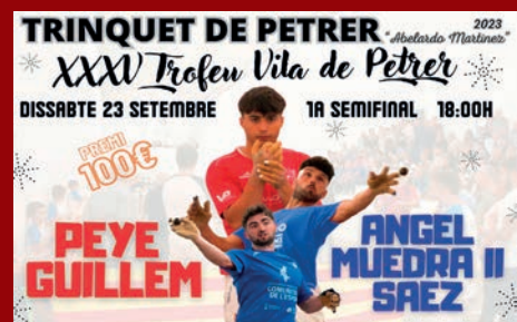
ARRANCA EL XXXV TROFEO "VILLA DE PETRER" DE PILOTA VALENCIANA