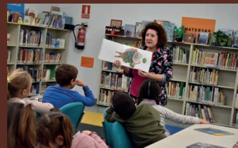
SOM DE PETRER: UN GRAN ACIERTO CULTURAL