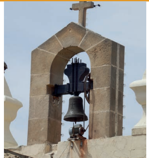
Ermita San Bonifacio. "Bonifacia"