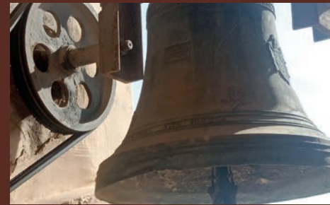
ESTE POBLE: EL DNI DE LAS CAMPANAS DE PETRER