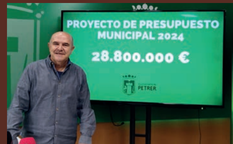
EL PRESUPUESTO MUNICIPAL ASCIENDE A 28.8 MILLONES