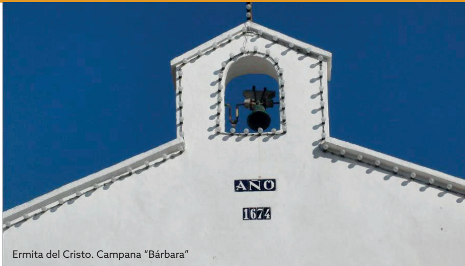
Ermita del Cristo. Campana "Bárbara"