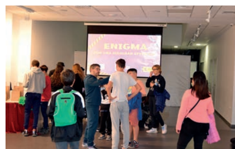
Scape Room. Enigma