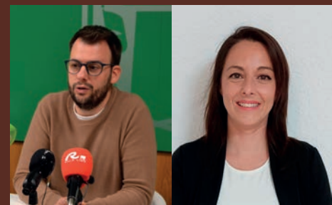
EL PSOE EXCLUYE A VOX DE LA JUNTA DE GOBIERNO LOCAL