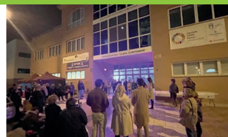
Manifiesto y Senda Silenciosa