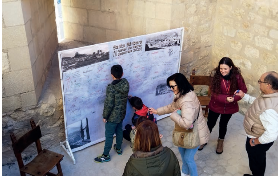
Varios visitantes firmando en el panel colocado en el interior de la fortaleza

Ya el domingo, se volvió a abrir el acceso al calabozo para recibir visitas y también se colocó en el interior de la fortaleza un gran panel en el que los visitantes, siguiendo así la tradición, plasmar su firma pidiendo un deseo. También, a mediodía, en la sala noble