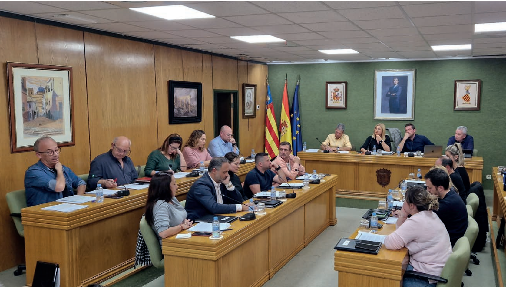
Imagen del pleno