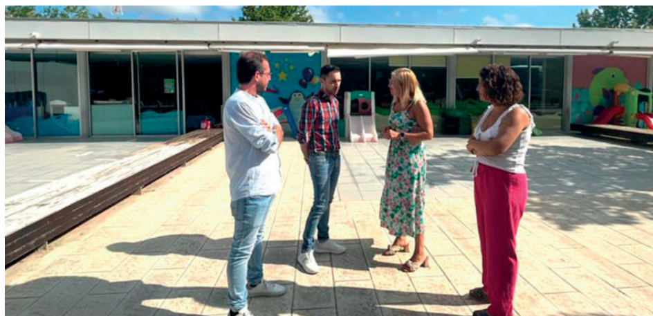
Visita a la E.I. Virgen del Remedio en julio de 2023