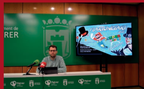
TEATRO, MUSICALES Y MAGIA, EN EL "MARIONETARI 2023"