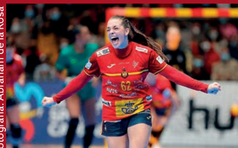
PAULA ARCOS LIDERA A ESPAÑA EN LA 1ª FASE DEL MUNDIAL