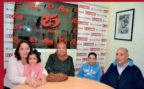
ESTE POBLE: DESDE GAZA A PETRER, UN CAMINO DE HORROR