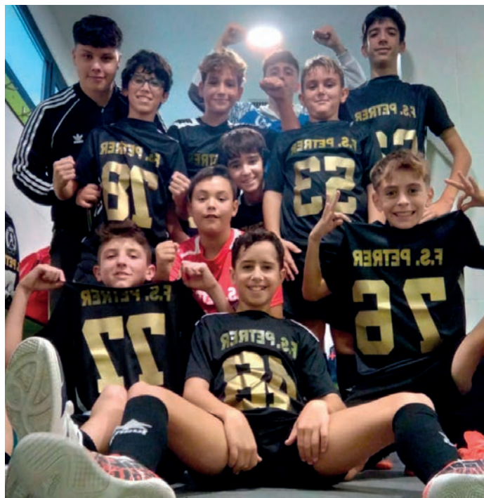
Fútbol Sala Petrer. Infantil B

Estos son los resultados de los equipos de la base: Alevín: FS Petrer 7-1 F.S.F Juventud D'Elx Infantil: FS Petrer B 2-3 S&C Publicidad Aspe; Benissa 3-4 FS Petrer A Cadete: Serelles Alcoy CFS 4-1 FS Petrer