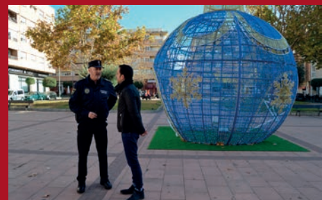
EL DISPOSITIVO DE SEGURIDAD PARA LA NAVIDAD SE ADELANTA