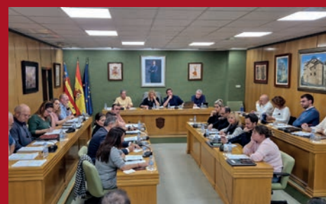
LA LEY DE LA AMNISTÍA "FLOTÓ" EN UN PLENO MUY TENSO