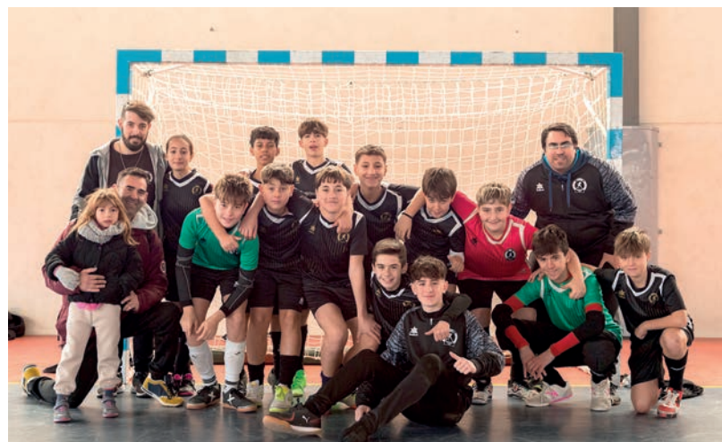
Equipo Infantil A