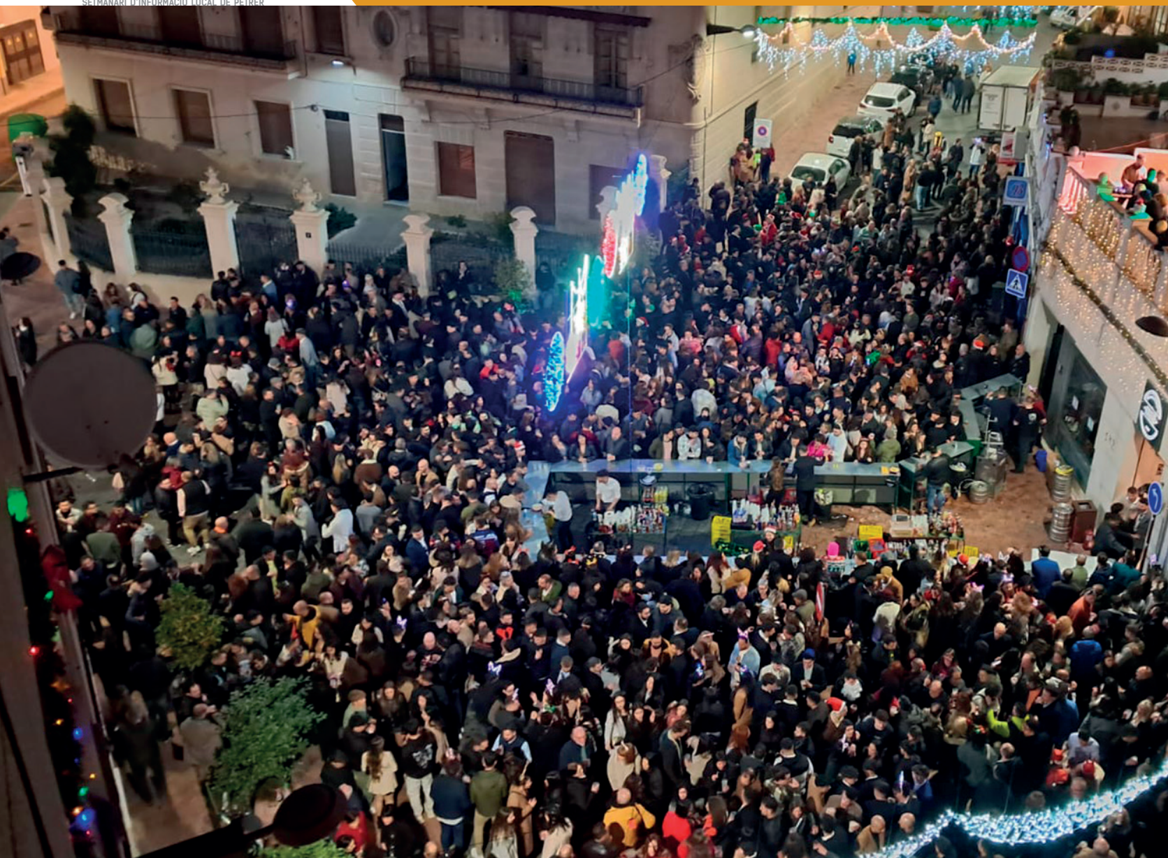
Tardebuena del 2023