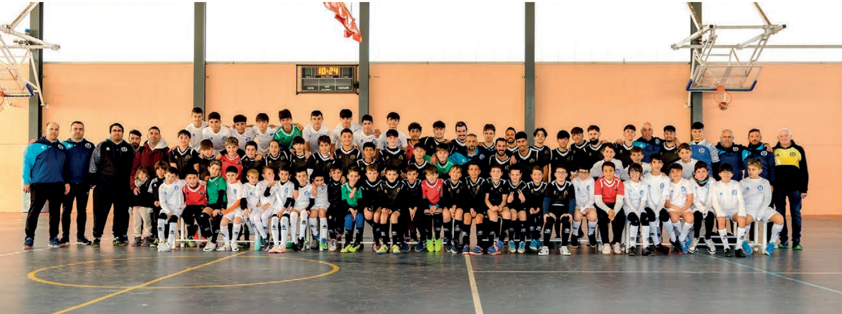
Foto de familia