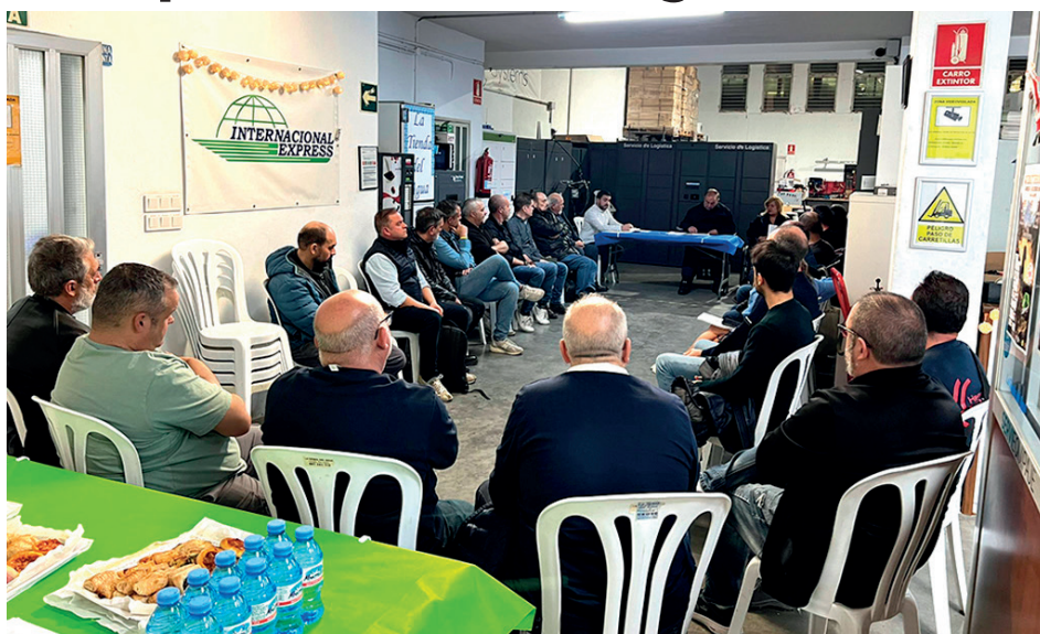
Imagen de la reunión constitutiva de la Agrupación

Sus principales objetivos son los de defender y mejorar las infraestructuras del polígono y la promoción de los intereses económicos, sociales y derechos de los propietarios, trabajadores y empresas. También pretenden que este órgano sirva de nexo de unión y coordinación de las empresas y empresarios, fomentando el espíritu de solidaridad entre los mismos, además de disponer con la administración todo tipo de actuaciones tendentes a mejorar los servicios del citado polígono. Asimismo, este nuevo colectivo empresarial