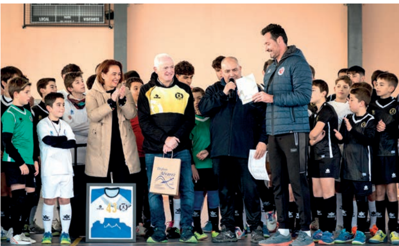
Entrega de una camiseta conmemorativa al Voleibol Petrer-Villena