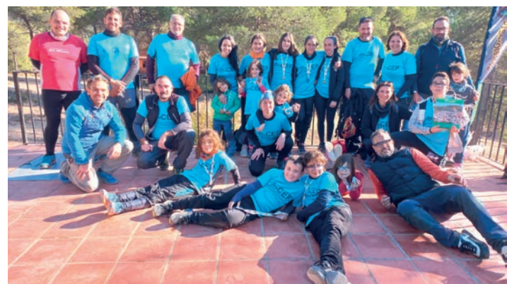
Tomaron parte 12 integrantes de la sección del CEP

Doce orientadores@s, entre 5 y 13 años, de la Escuela de Orientación del Centro Excursionista de Petrer, estuvieron participando en la carrera del campeonato autonómico de distancia larga de orientación de la Comunidad Valenciana 2023, que tuvo lugar en Biar. Los recorridos de las diferentes categorías fueron muy exigentes, a nivel técnico y físico, con terreno muy escarpado, zonas de bosque espeso y vegetación dura, pero todas y todos lograron llegar a meta completando todas las balizas.