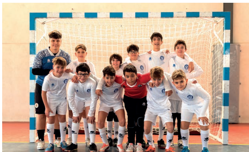
Equipo Infantil B