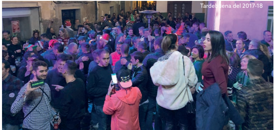
Tardebuena del 2017-18