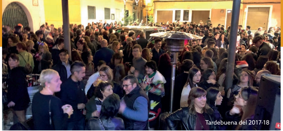
Tardebuena del 2017-18