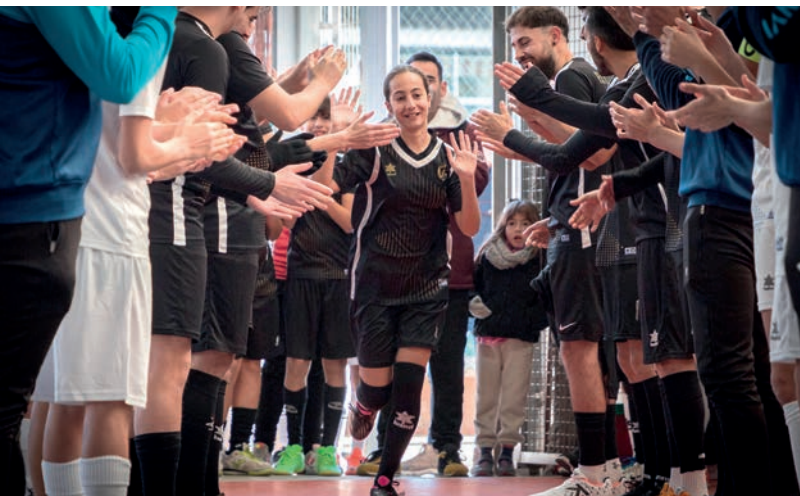
Imagen de la presentación de los diferentes equipos