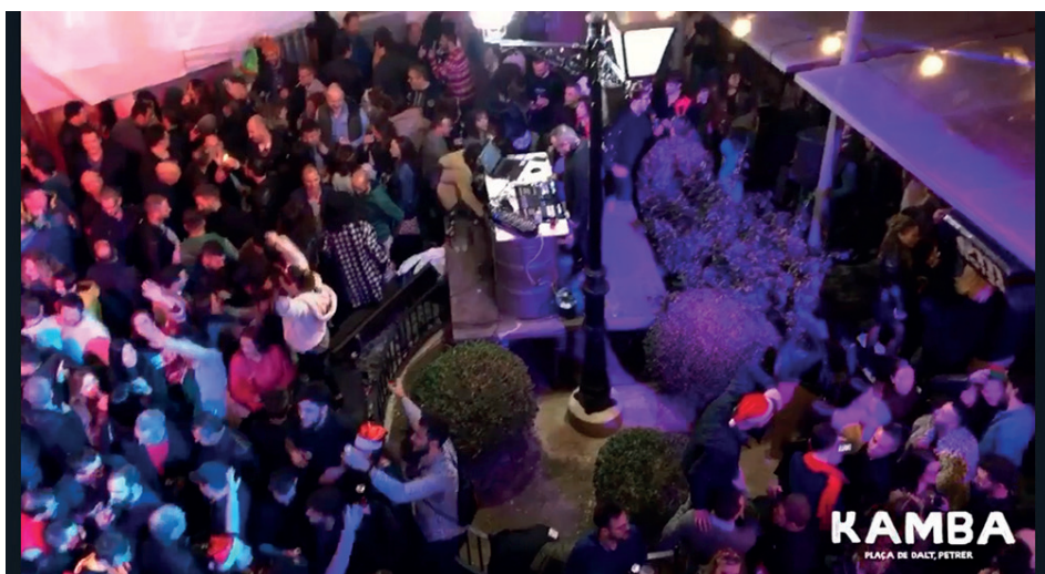
Tardebuena del 2019

L as vísperas también se disfrutan en Petrer al igual que en multitud de ciudades y pueblos de España. Es el caso de la tarde de Nochebuena, denominada popularmente como "Tardebuena". El punto de encuentro es el cruce de las calles Gabriel Payá con José Perseguer gracias a la iniciativa de un local de copas y que cada año reúne a más personas para ir calentando motores y llegar después a la cena familiar por excelencia en estas fiestas de Navidad. Una tarde que se está convirtiendo, también, en un día importante para los negocios de hostelería.