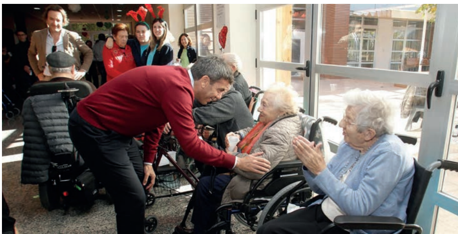
Carlos Mazón saludando a varios usuarios de la Residencia

El presidente de la Generalitat, Carlos Mazón, visitó el pasado domingo, día de Nochebuena, la Residencia Geriátrica La Molineta de Petrer con motivo de las fiestas navideñas. El jefe del Consell dirigió unas palabras a los presentes felicitando las navidades tanto a los residentes como a los trabajadores de los que destacó su cariño y profesionalidad. Mazón incidió en el buen ambiente que se vive en la residencia añadiendo que nunca olvidaría esta primera visita al centro como presi-