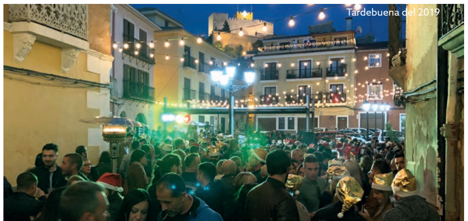
Tardebuena del 2019

Siguiendo la estela de lo que comenzó en la vecina Elda la mañana y tarde de Nochebuena, Petrer también se sube al carro para disfrutar de un inicio de la Navidad celebrándolo de antemano con amigos o familia. La "Tardebuena", gracias a un local de copas situado en el corazón del casco urbano y centro neurálgico de casi todo lo que acontece en nuestra localidad, miles de personas pudieron disfrutar una vez más de un buen ambiente festivo y navideño horas antes de ir a casa y para pasar la noche tradicionalmente más familiar del año.